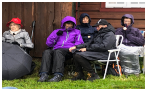
En kald og våt forsamling, men like blide likevel