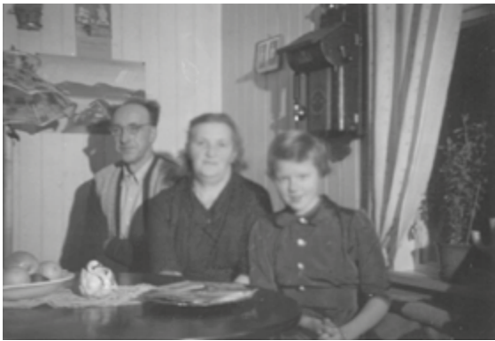
Jul i Forradal, 1957