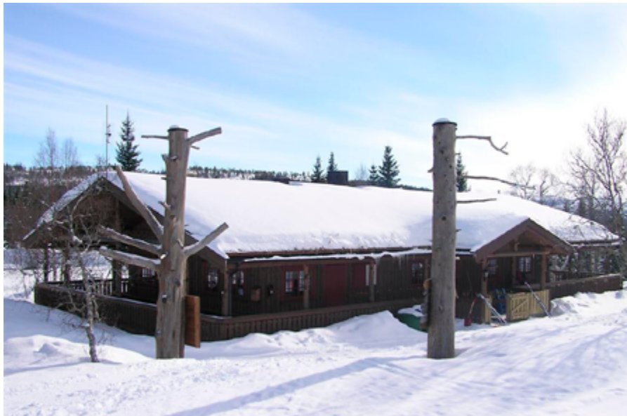
Skihytta på Åstjønna.

I år som så mange år tidligere inviterte Hegra Sogn til gudstjeneste i skihytta ved Åstjønna, på Palmesøndag, ved inngangen til påskeuka. Det var svært gledelig å se at så mange hadde funnet vegen opp dit og fylt skihytta til siste stol.