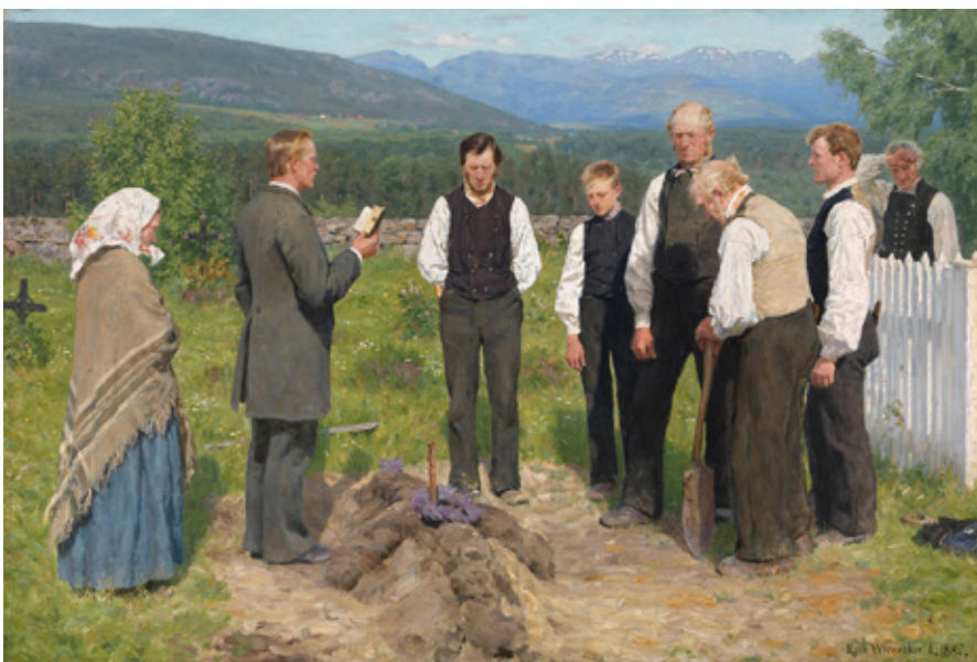
Erik Werenskiolds berømte maleri «En bondebegravelse» fra 1885.