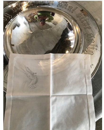
Flott gave til dåpsbarnet hjelper familier på Madagaskar.

Svært mange norske menigheter kjøper dåpskluter fra Madagaskar, og denne virksomheten sysselsetter ca 30 kvinner.