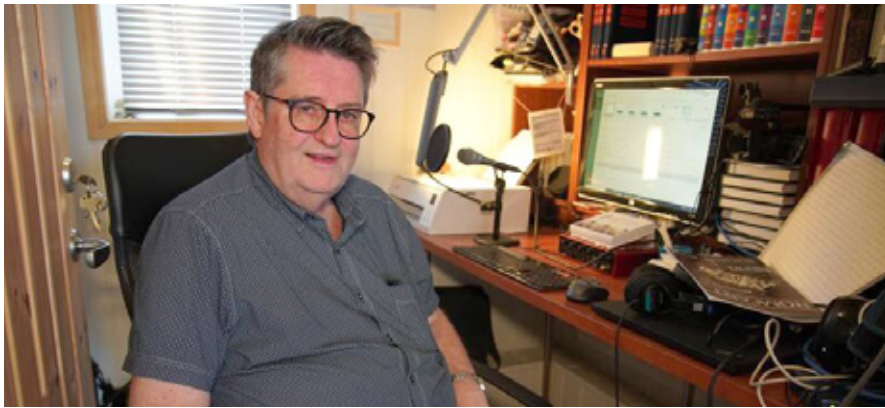
Her i garasjen i Husbyhagen blir både påskelabyrint og andre program laget.

og eggehviten for å male på skallet med vannfarger i gilde påskefarger. 1. påskedag samles vi hele familien rundt frokostbordet for å spise en solid eggefrokost. Min faste påskespøk var å plassere mitt uthulte egg i pappas eggglass, og han spilte antagelig stort årlig skuespill med å være overrasket og paff da han kakket toppen av egget og fant det tomt! Siden var det å høre festgudstjenesten på radio og synge med på «Påskemorgen slukker sorgen» og «Deg være ære» – to salmer som er så lette å synge!