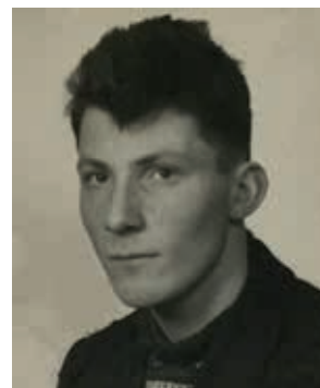
Ole som ungdom.

Hjemme satt tre unggutter, en nesten blind bestemor, en bestefar og en hund og skulle feire julekvelden. Den mellomste sjøfarerbroren tok ansvar for maten. Grisesteken brukte de egentlig å spise 1. juledag, men dette året jukset de litt i elendigheten og lot grisesteklukta spre seg i huset en dag tidligere. Det stod godsaker både på bordet og under treet, og da bestefar tente sigaren sin ble det jul alikevel.