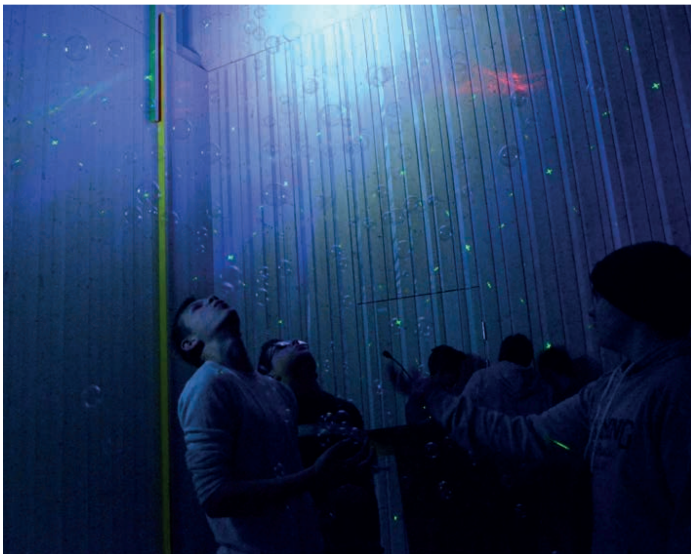
Teknikkonfirmantene får leke seg med laserlys og såpebobler.

Det vil være konfirmanter som styrer all teknikken på de tre ungdomsgudstjenestene våren 2018: 14. januar, 4. februar og 11. mars. Vi håper mange vil komme og se hva teknikkonfirmantene har lært dette halvåret!