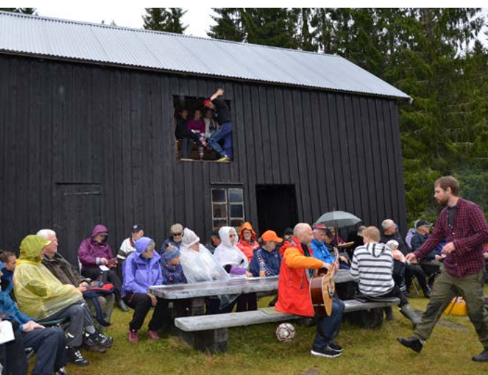
Ungdommen i låveluka