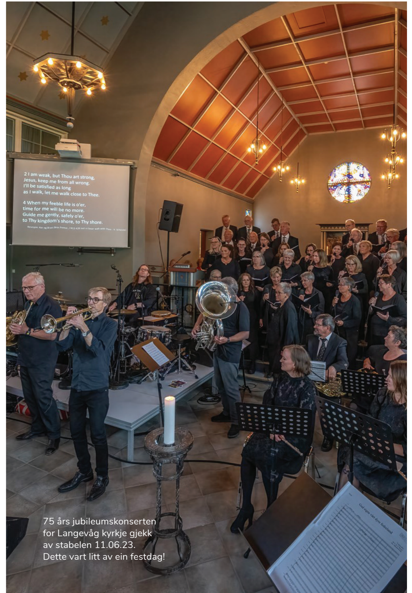
75 års jubileumskonserten for Langevåg kyrkje gjekk av stabelen 11.06.23. Dette vart litt av ein festdag!