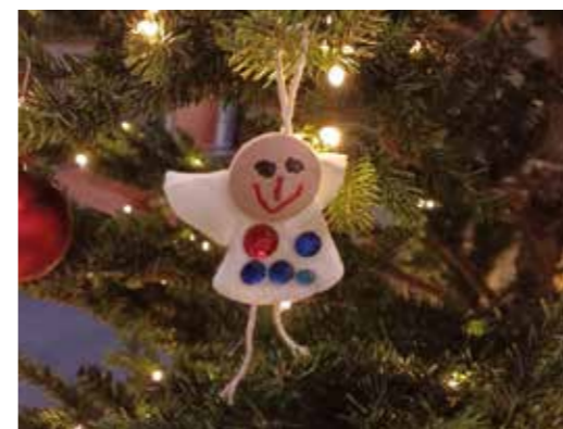
Bilde over til venstre: Morgonbøn: Langevåg kyrkje er rigga til morgonbøn - kvar tirsdag møter staben til morgonbøn - ei fin og god samling om evangelietekstar, refleksjon, salmesong og bøn. Til høgre, øvst: Utsnitt av maleri som heng bakerst i Indre Sula kyrkje. Bilde under: Til venstre: Før jul kjem alle barnehagane på julevandring i kyrkjene våre. På førehand har dei laga nydelege englar i alle variantar og storleikar som vi kan få pynte kyrkjene med til jul. Det er så koseleg å sjå alle dei flotte og kreative englane som blir skapt av små barnehender.