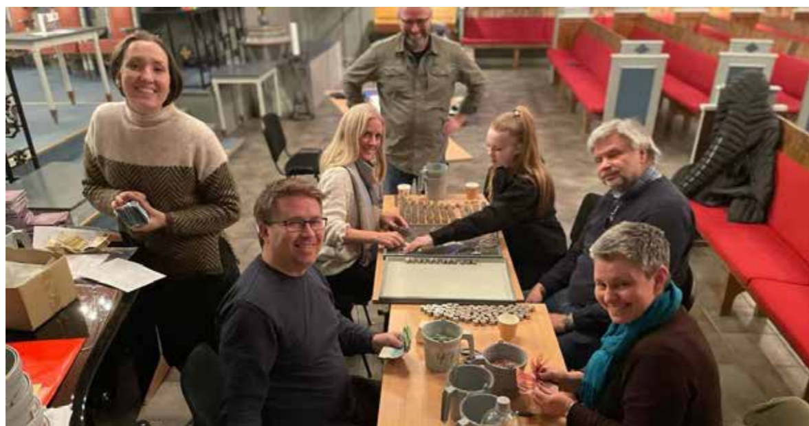
Bilde over: Tellekorps etter KN-aksjonen i 2022 - Det er mykje kontantar som må tellast opp etter at konfirantar og frivillige har gjort ein strålande innsats som bøssebererarar rundt om på heile Sula. I 2022 vart det rekordår i høve innsamlinga og det vart samla inn heile 129.430,- totalt med kontant, vipps, og facebookinnsamling.

Vi har også hatt glede av inntekter frå finansielt resultat frå kraftleverandøren, som har komen til fråtrekk på straumrekninga. Dette vil ikkje halde fram i same grad framover, då regjeringa har vedteken høgre moms hos kraftselskapa. Straumutgiftene vil difor bli høgre i 2023 enn i 2022. Vi arbeidar med å finne løysingar for korleis vi kan bli meir drifseffektive på dette området.