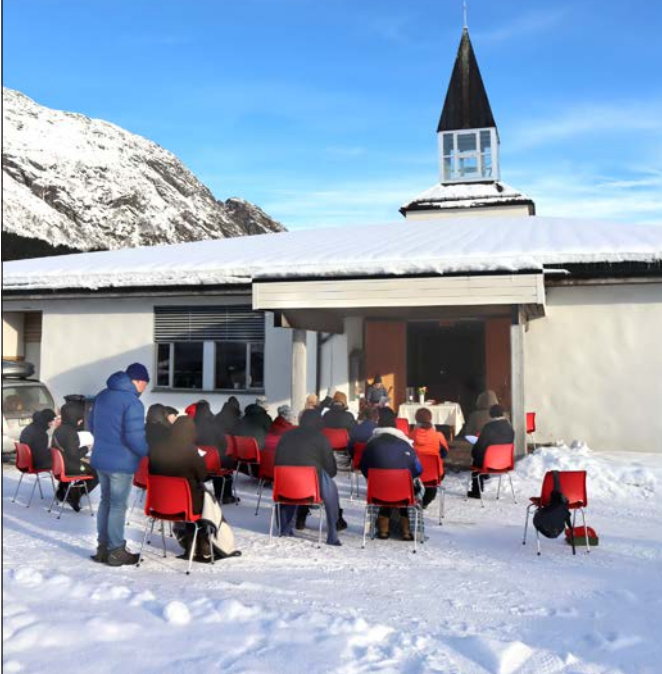
Det var kaldt å vere på utegudsteneste på Vassenden.

Mellom huer på hovudet og med vottar som ikkje berre er på stas, set ei dame og frys. Men ho er ikkje gjennomkald, trøystar ho seg med.