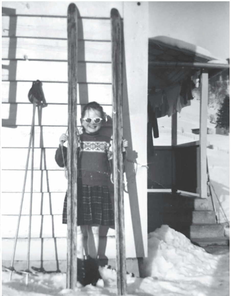
Forfattaren klar for skitur ein gong for ein del år sidan.

Nydeleg ver, kvite vidder, manglande solkrem. Kva gjev det? Jau, solbrende kjarar.