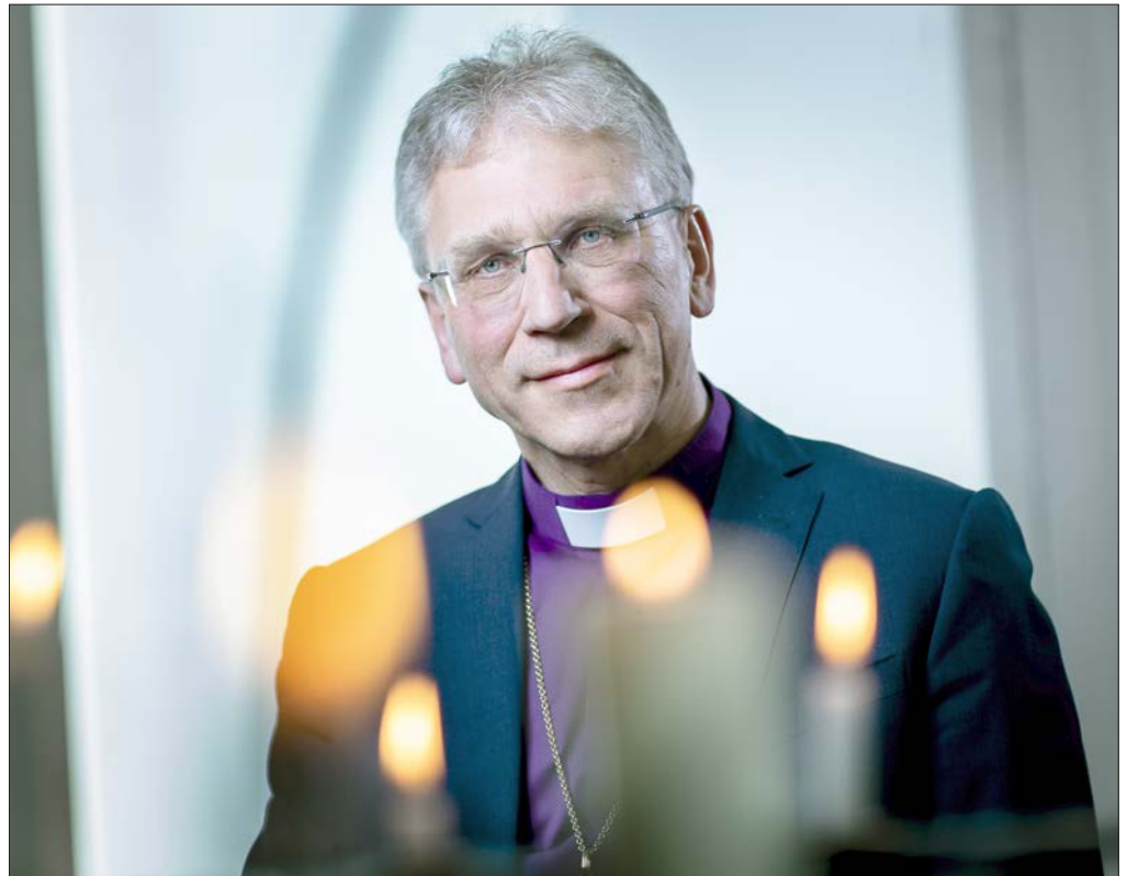
Olav Fykse Tveit er frå 2020 preses i Bispemøtet i Den norske kirke.

No skal vi feire påske, ikkje berre ha påske i kalenderen. I år ser det ut til at det er litt nye vilkår. Så vi planlegg påskefei-