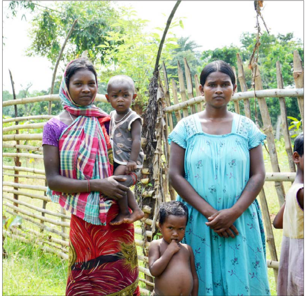
Felles 17-maifeiring for Dvergsdal, Sunde og Myklebust i 1948. Vi ser Fana til Myklebust Ungdomslag som Nikolai Astrup måla.

Steinarbeidarane, dei fleste frå santalsamfunnet, lever og arbeider under svært vanskelege tilhøve og det finst ikkje fagforeining. Det førekjem barnarbeid og grov utnytting av jenter. Normisjon i lag med samarbeidspartnarane, arbeider for å betra «steinknuserane» sine rettar og for å gje dei betre utsikt til ei god og trygg framtid. I tillegg ønskjer ein å rette innsatsen inn mot tiltak som stoggar dei negative ringverknadane steinindustrien har på skogen, jorda og