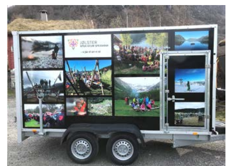
Speidaren har fått seg ein staseleg billengar, dekorert med foto av ymse speidaraktivitetar