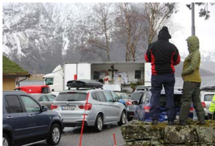
Det var surt og kaldt under påskekudstenesta ved Helgheim kyrkje. Likevel var det mange som tok turen.

vart lagt opp til to køyr inn gudstenester, ei på Vassenden, på Jølstrholmen, og ei ved Helgheims kyrkja. Det sure vëret gjorde nok sitt til at det ikkje vart det heilt store