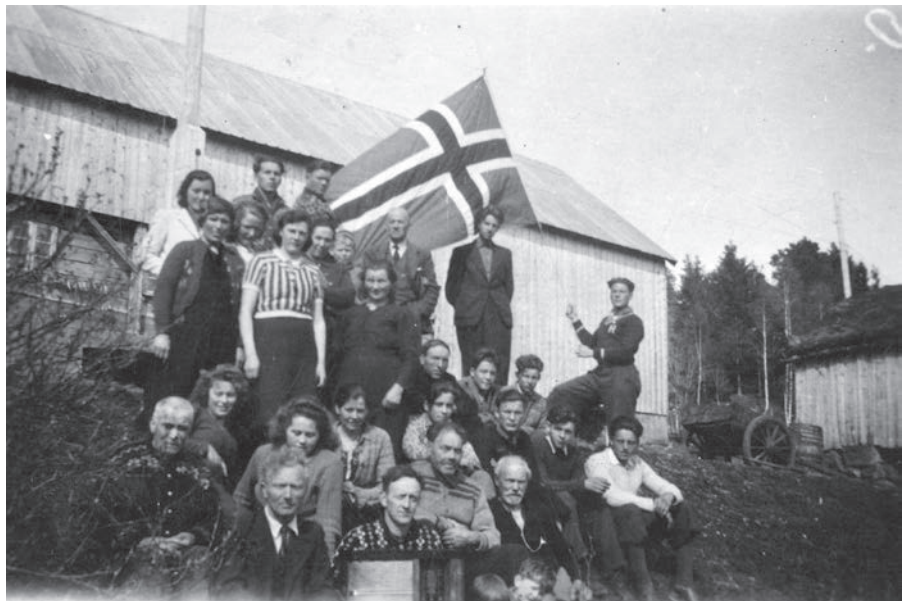
Her er det feiring i tumet i Stofringsdalen. I framste rekkje ser vi radioen som er henta fram att.

Bladet hadde også eit oversyn over andre Jølstringar som hadde vore delaktige i mot- standsarbeid på ymse vis, også slike som hadde sabotert arbeidstenesta.