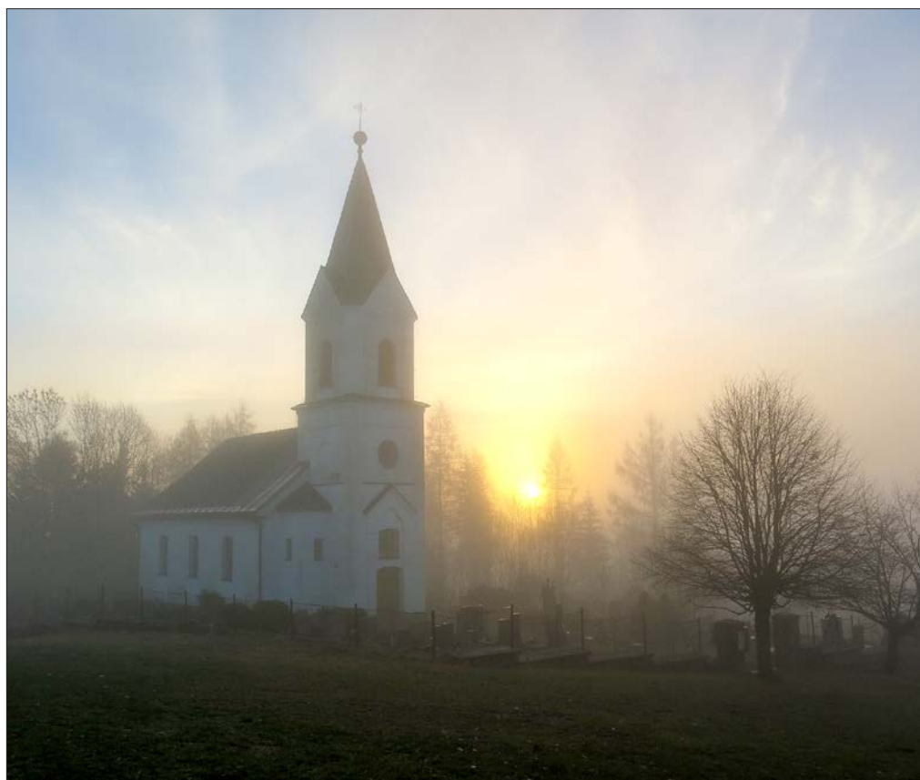
Kyrkja i Krizlice vinterstid.