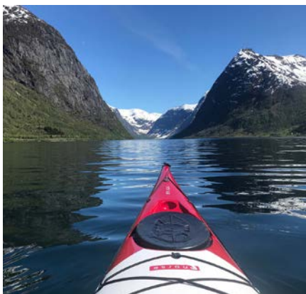
Kanopadling er ein av mange aktivitetar i speidaren.