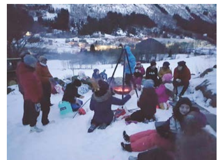
Akedag med bålpannekos

Vi ynskjer alle jølstringar ein riktig god sommar!