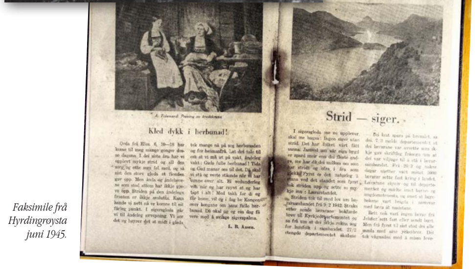
Faksimile frå Hyrdingrøysta juni 1945.