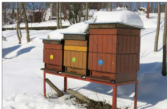
Honningproduksjon er ein stor tradisjonsrik aktivitet i Krizlice.