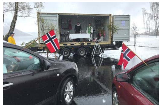
Surt og kaldt, men likevel ein del som tok turen til gudsteneste ved Helgheim kyrkje 17. mai.