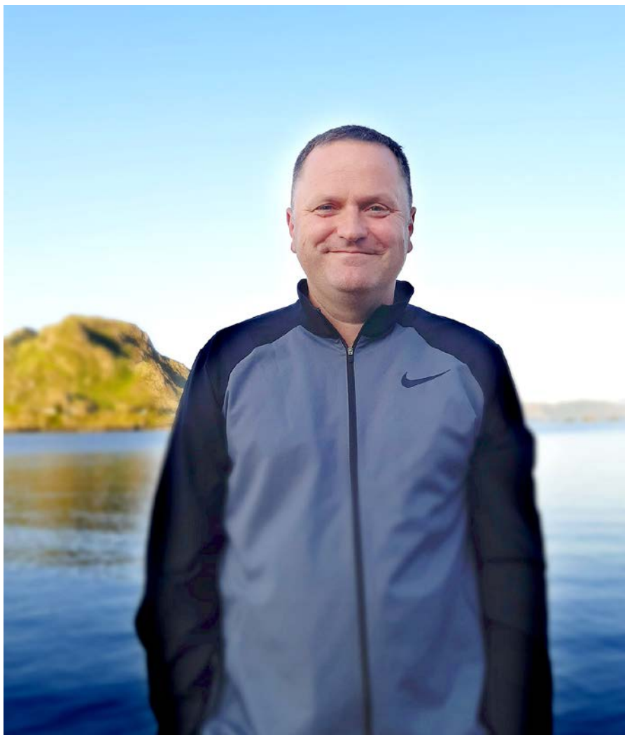
Den nye prosten har si noverande gjerning i bavgapet lengst vest i Sunnfjord.

– Eg veit no ikkje om eg blir verande i stillinga så lenge. Det får vi sjå etter kvart. Men eg hadde lyst til å bli verande i Sunnfjord ei stund til og eg har nett kjøpt hus i Florø. I tillegg har eg fire jenter som går på skule der, så då er det naturleg å bli verande ei tid. Så når denne sjansen baud seg,