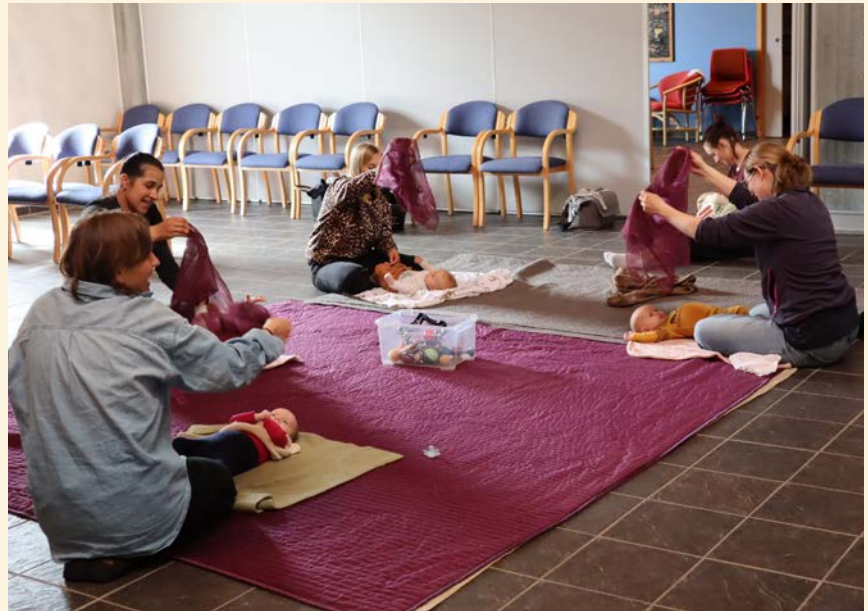
Smil og glede når babysonggruppa samlast på Vassenden kyrkjesenter.