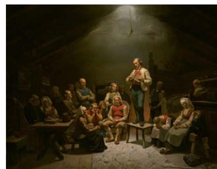
Haugianerne (1852), Adolph Tidemand. Nasjonalmuseet - Nasjonalgalleriet, Oslo.

Hans Nielsen Hauge var ein allsidig mann. Han var kjent for å strikke når han gjekkk, og kanskje var det sokkar han strikka.