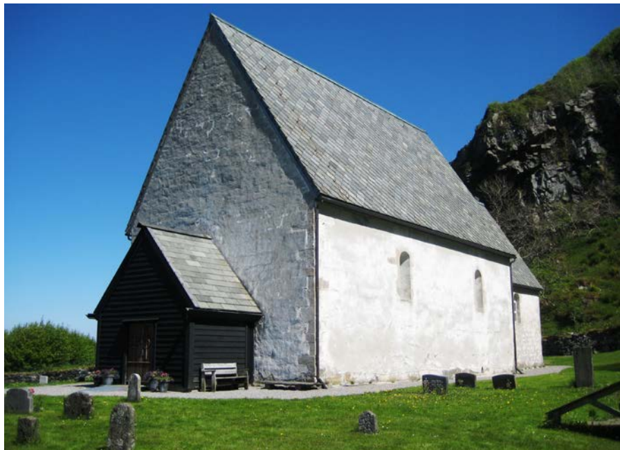
Kinn kyrkje ligg på øya Kinn og er bygt i perioda 1150-1200.

Det vert opa kyrkje ved frivillig vertskap ved