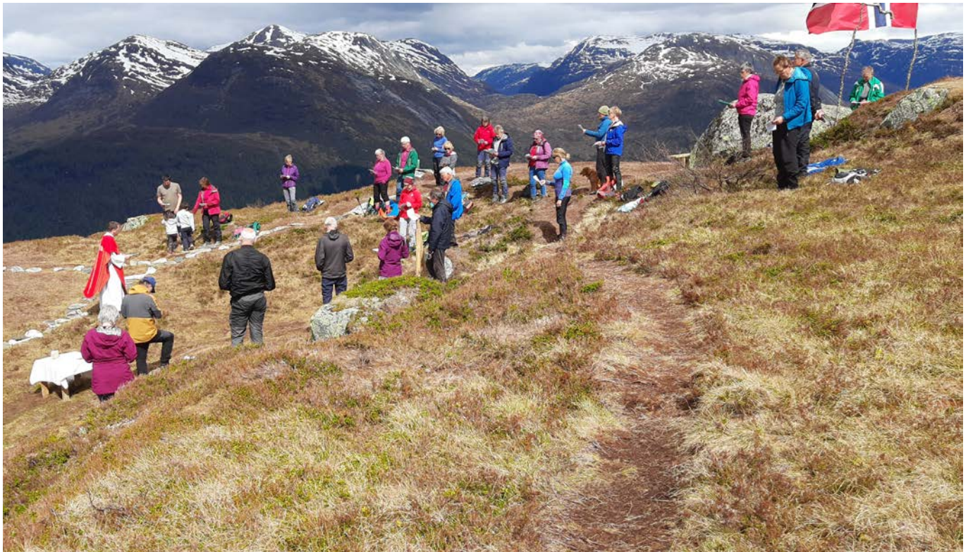
Tradisjonen tru var det også i år gudsteneste på Hamnanova 2. pinsedag.