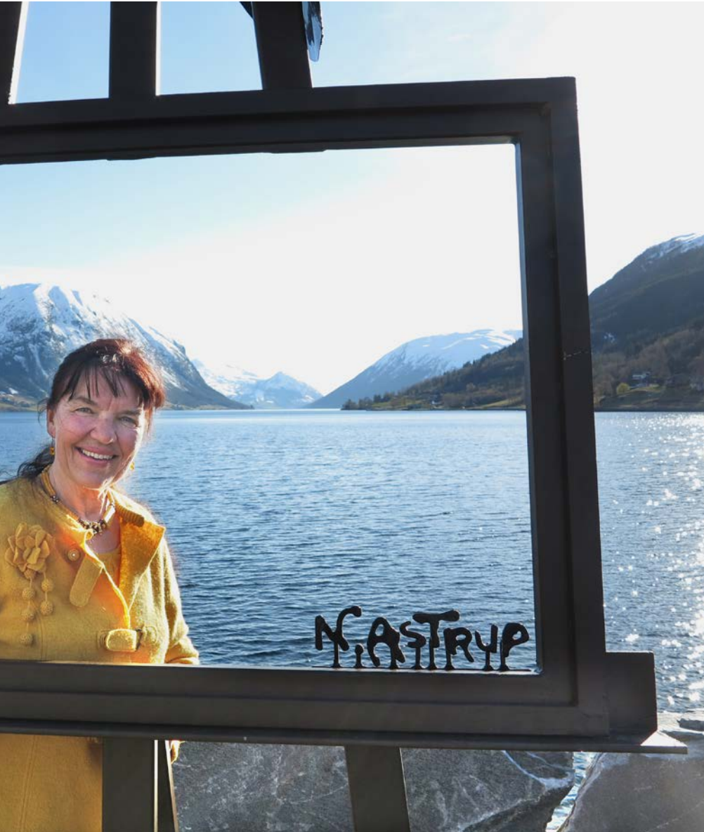
«verdas vakraste ramme».

ge vegar. På mange måtar kan vi seie at vi dei siste 100 åra har skapt stor framgang på helsefronten, men motsett effekt på natur og klima i verda.