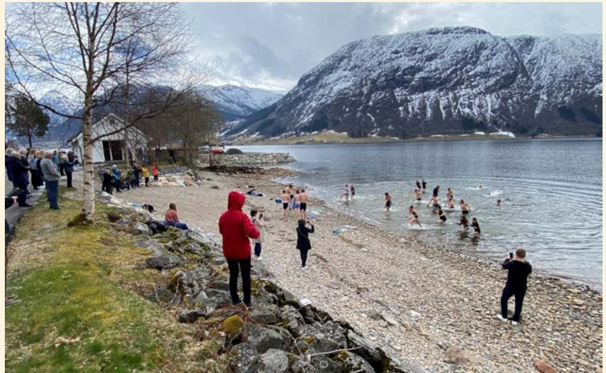
Grunna pandemien vart påskeplasken i mai i år, men det la ingen dempar på badinga.