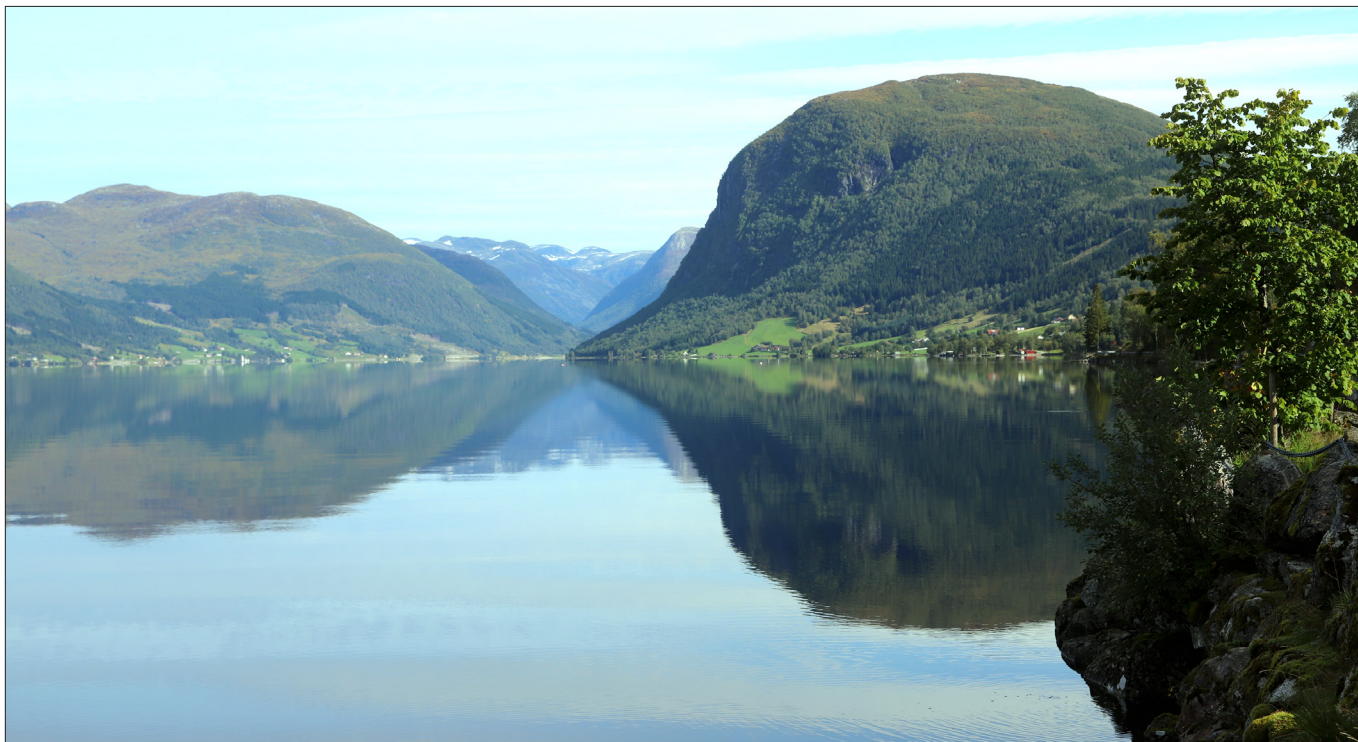
Kva gjer du for å ta vare på skaparverket, spør Knut Osvoll. Illustrasjonsfoto frå Jølster.