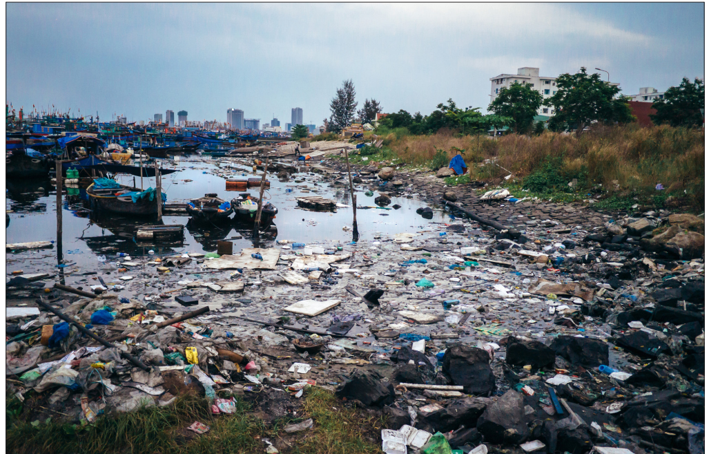
Dumpa rett i naturen: Dei innsamla pengane i år skal gå til å hindra slike bilete som dette. Land i Sør-aust-Asia manglar system for å handtera dei store plast- og søppelmengdene som no blir dumpa rett ut i naturen. TV-aksjonen er innsamlingsaksjon, men også informasjons- og baldningskampanje. Til beste for heile verda.

No er havet truga. Kvart år hamnar 8 millionar tonn plast i havet. Det betyr at om lag 15 tonn plast hamnar i havet – kvart minutt. Det kan vera vanskeleg å førestilla seg kor mykje dette faktisk er, men prøv å sjå føre deg ein lastebil som dumpar plastsjøppel i havet kvart einaste minutt; døgnet rundt, heile året.