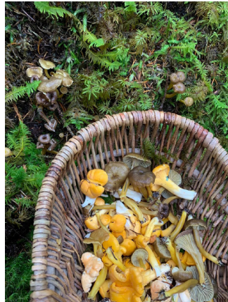
Det er kjekt å sanke kantarell i «sopptember».