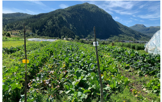
Grønsakåkrar på Vie.

September er her, eller Sopptember som eg likar å kalle denne første haustmånaden. Årsaka ligg i namnet og ein personleg trong til å hauste av alt det naturen byr på. Dagen i dag har gått med til å tråle gamal bjørkeskog på jakt etter skogens gull: kantarellen.