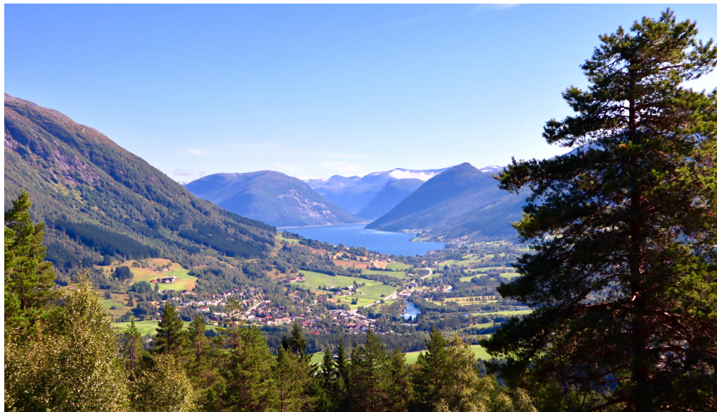
Utsikta frå støylen er framifrå.

Forkynnaren Silje Sørebo minnte om Meistren sjølv, der ho tala til folket frå ein stein under open himmel. Nett slik Jesus gjore langs Genesaretsjøen i Galilea for 2.000 år sidan. Her spreidde han den radikale og revolusjonerande læra si. Elsk dine fiendar, snu det andre kinnet til, fjern bjelken i ditt eige auge før du bryr deg om flisa