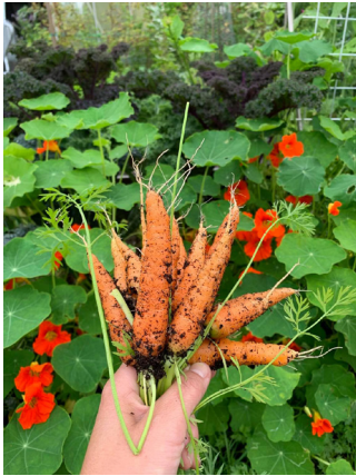
Sjølvdyrka gulroter frå Vie andelslandbruk.