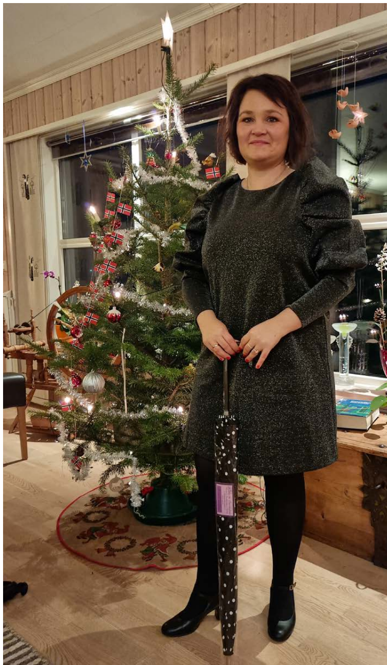
Tekstforfattaren fotografert framfor «jaktbyttet» julafta 2021.

Øks og sag tek vi med oss og so legg vi i veg. Det skal pratast litt undervegs, prate seg litt vekk, syngje og diskutere. For kva skal vi gå for i år, breitt og lågt eller smalt og høgt. Mor