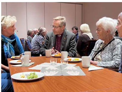
På samlinga for frivillige vart det tid til samtale rundt borda.

Om du vil vere med og gje ei gåve til kyrkja på Cuba, kan du nytte kontonummer 1503.02.13537 (Normisjon), eller Vipps 96005. Merk gåva «Prosjektnummer 351002»