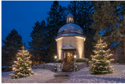
Gedächtniskapelle Stille Nacht – Heilige Nacht i Oberndorf står på staden der kyrkja songen Glade jul vart framført for første gong i 1818 i si tid stod.

Sjølv om mange har det vanskeleg her til lands, så er det eit land i Europa som har det verre. Julaftan er det ti månader sidan det ukrainske folket vakna til invasjon og fullskala krig, sett i verk av leiinga i eit naboland og