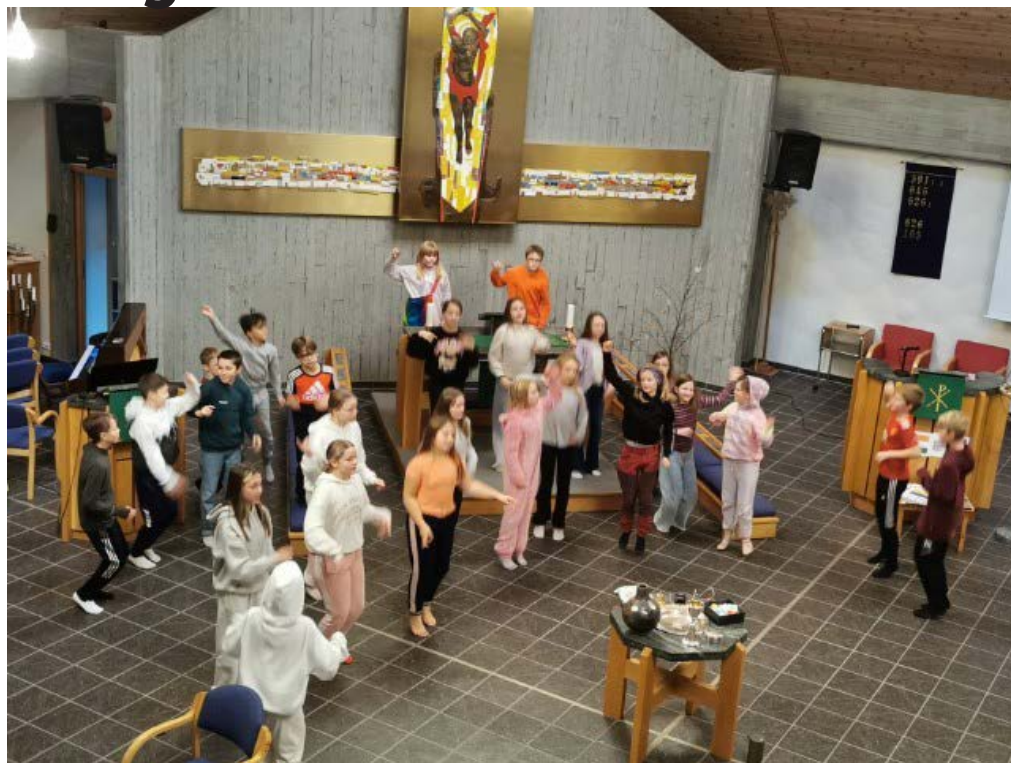
Svært mange var med på «Lys vaken helg».

Borna tok og del i gudstenesta søndagen med dans. Dei hadde tydelegvis hatt det kjekt, for