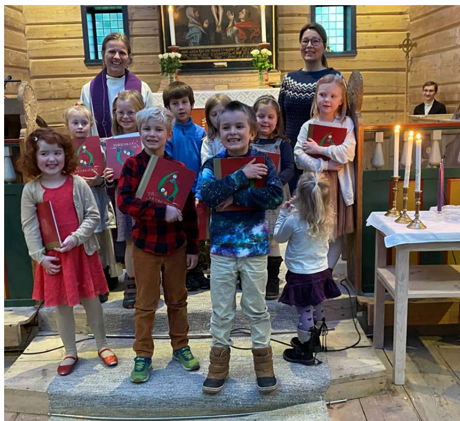
6-åringane som fekk bok i Ålbus sokn.

kyrkjelyden sitt prosjekt i India gjennom Nor Misjon.