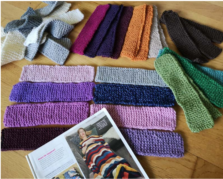
150 fargerike lapper skal bli til eit varmande teppe.