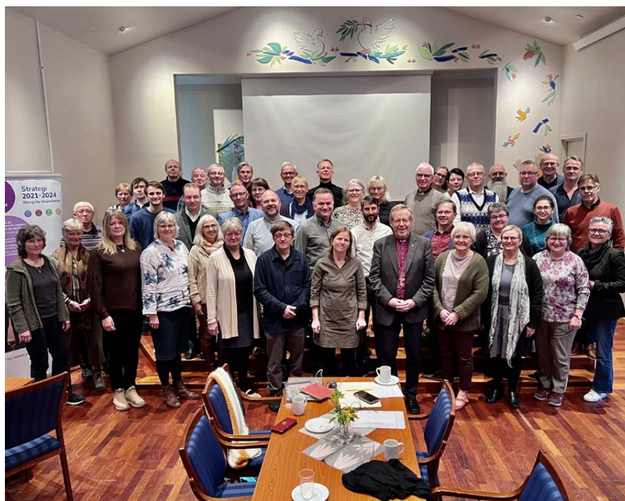
Biskopen møtte dei tilsette.

det og vestlendingane. Ville han, som austlending, forstå folket og språket? Det første han fekk var eit «skjonnetssjokk» når han