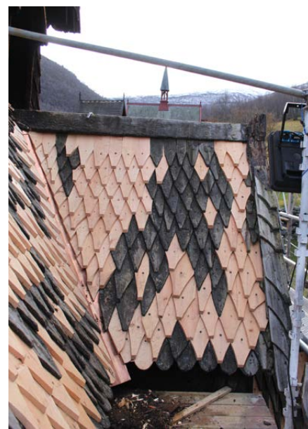
Kun dårlege takspone vart bytta på Borgund stavkyrkje.