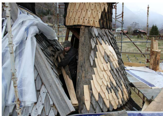
Reparasjon av absis på Borgund stavkyrkje