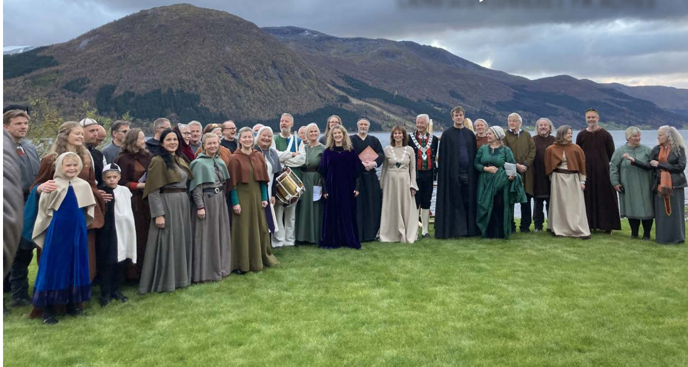
Aktorane og ordførarar.