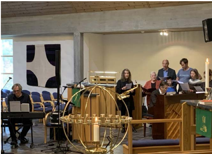
For høvet var det også kor som var med på salmane