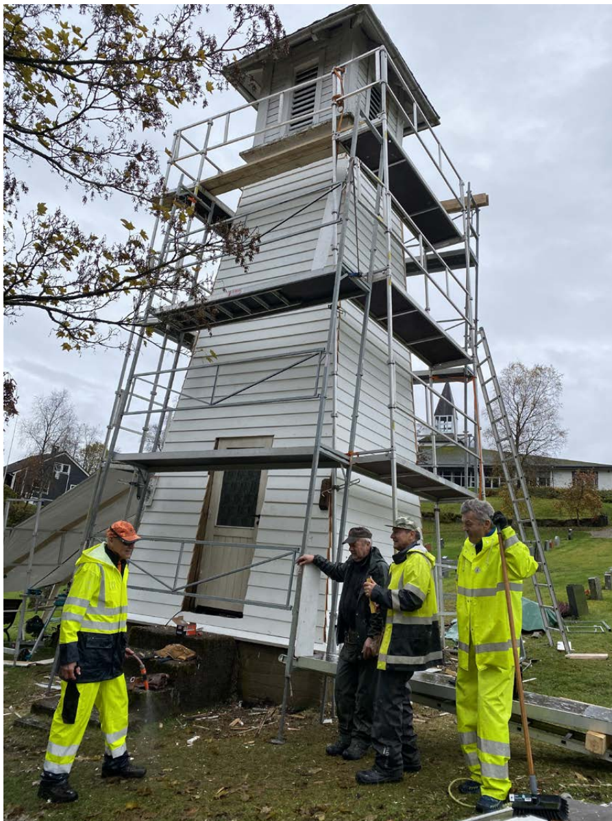
Kyrketårnet under rehabilitering.

Været vart etter kvart så vått at arbeidet på toppen av tårnet vert utsett til våren-25. Då skal heile klokketårnet få eit nytt strok måling, og eit nytt, fint kors kjem på plass.