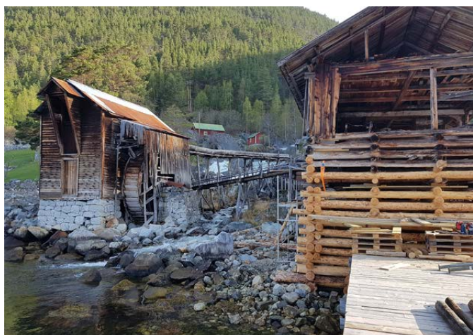
Nytt lafta bolverk på oppgangsgaga i Offerdal.