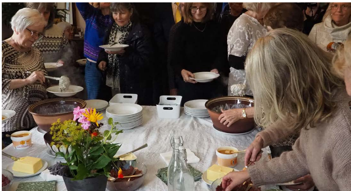
Bygggraut i prestegarden under jubileet.