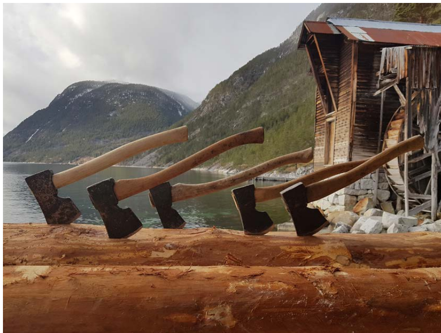
Økser i nytt bolverket med Mølla i Offerdal i bakgrunnen.

Slåtten grind & laft er nett ferdige med å restaurere bygga i Astruptunet - eit stort og