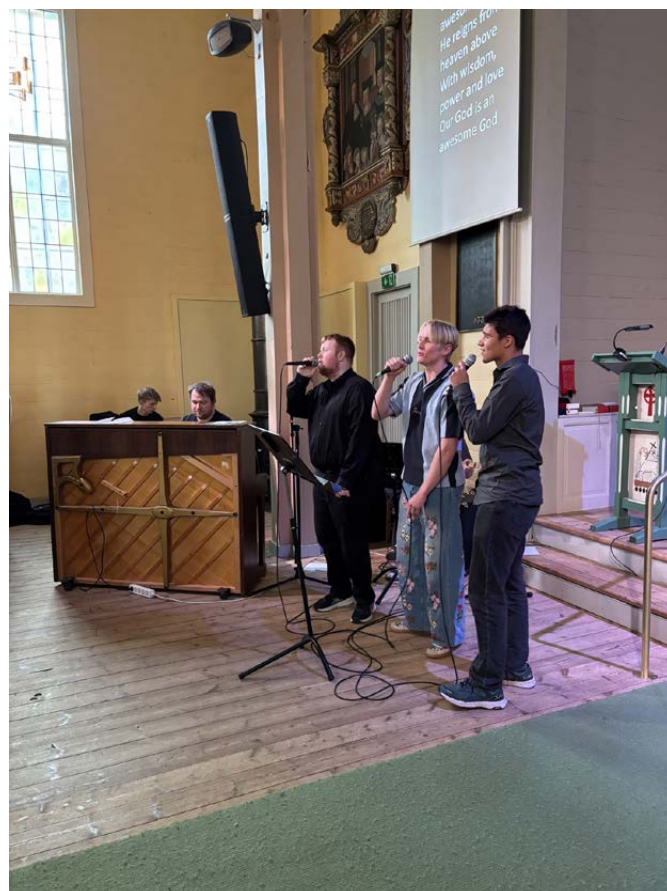
Elevar frå Sunnfjord Følkehøgskule var forsongarar på påfyllsgudstene i Førde kyrkje.