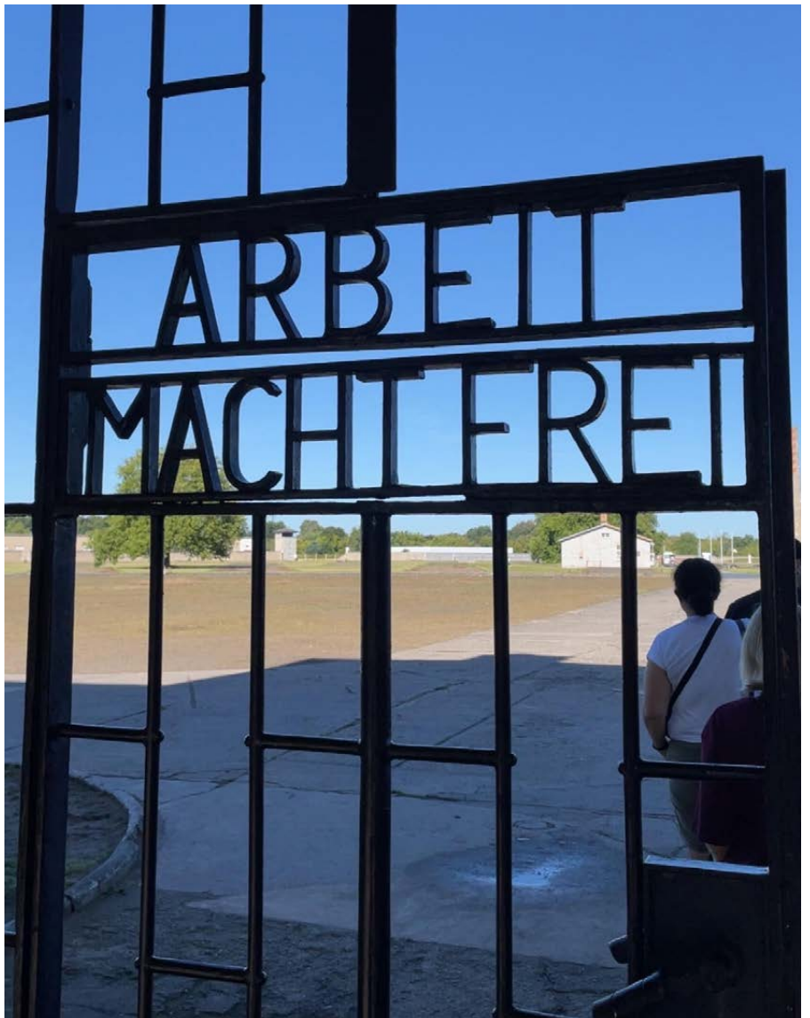
Sterke inntrykk frå Sachsenhausen.

i mot når dei spør om panteflasker, og folk som kjøper dei ulike produkta som er for sal. Såleis er det bygdefolket som