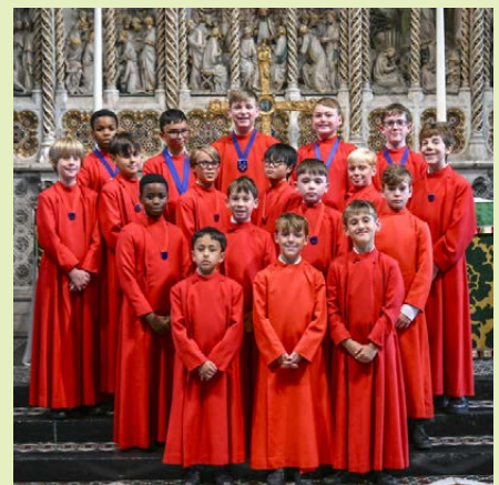
Gutane frå Ely domkor kjem til Førde tysdag 7. juli.

(Ely cathedral choir) frå England. Ely Cathedral Choir skal på turné og kjem til Førde med eit gutekor med unge og eldre gutar. Dei skal og ha konsert i Selje kyrkje laurdag 4. juli, i samband med Seljumannamesse. Konserten er gratis, men det vert høve til å gi kollekt.