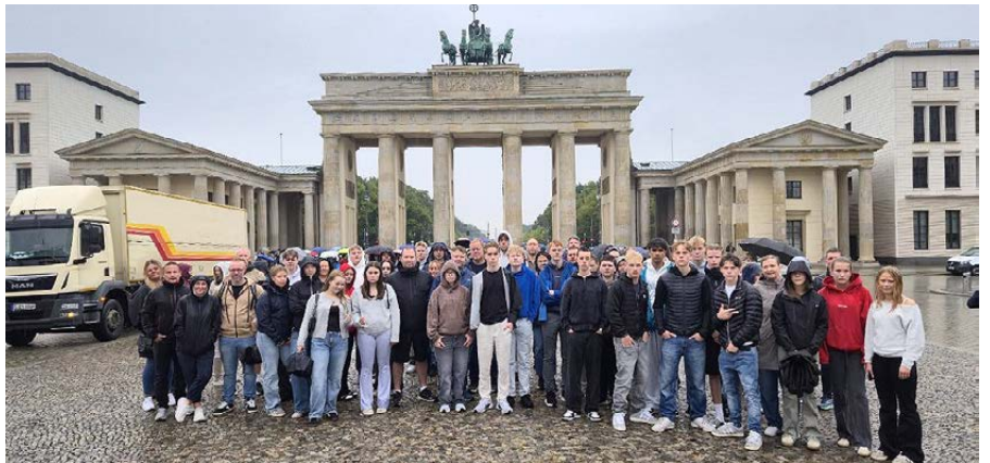
10. klassingane frå Naustdal framom Brandenburget Tor i Berlin.