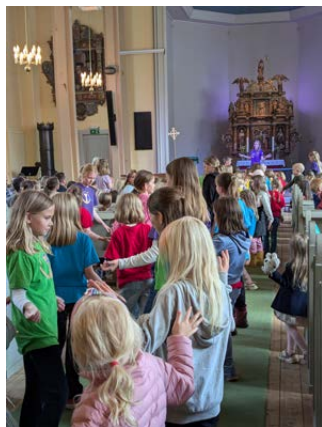
Frå Vakuumdagane 2024.

Barna som går i 5.-7. klasse er invitert til klubbkveld kl. 18.00 – 19.30 annan kvar fredag. Det blir leik, konkurransar, litt mat og spel. Oppstart 21. august .