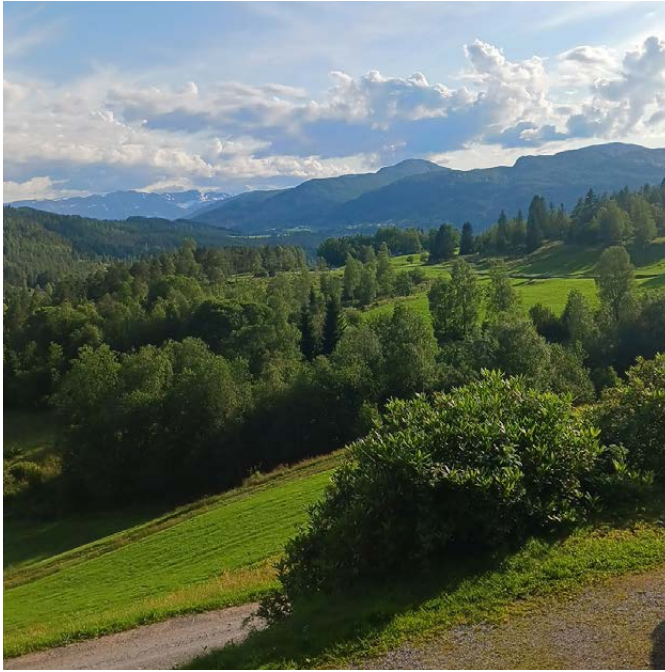
Utsynet frå Kleiva er stort og fritt. Her trivs tre generasjonar på garden.