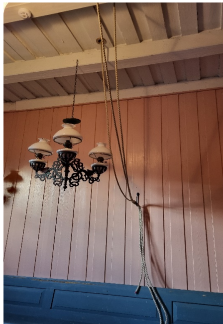
Tauføring, Fon kirke

Installert automatisk lukeåpner og klokkeringing med tau fra kirkens våpenhus. Fon kirke er automatisk fredet og prosjektet er godkjent hos Tunsberg biskop og riksantikvar. Prosjektet er ferdigstilt.