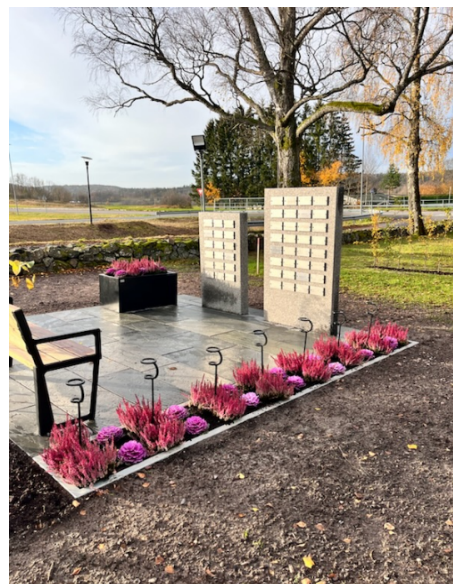
Navnet minnelund, Undrumsdal kirkegård

Undrumsdal kirkegård, navnet minnelund. Navnet minnelund er etablert på en ubrukt del av et kistegravfelt syd på gravplassen. Minnelunden har fått et dekke av steinheller, to minnesmerker i granitt og delvis innramming med hekk. Prosjektet er ferdigstilt.