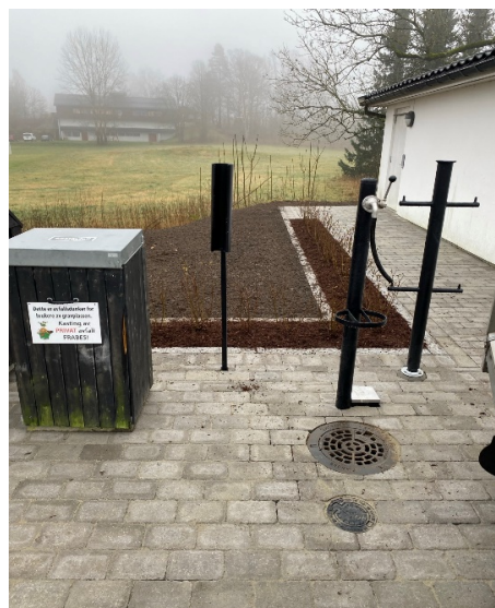
Ny vannpost Fon kirkegård

Fon kirkegård, etablering av ny vannpost og rehabilitering av kloakk. Eksisterende vannpost som ligger inne på det fredete området er fjernet samtidig som eksisterende avløpsledninger er blitt rehabilitert. Vannposten og avfallsstasjonen er etablert utenfor sikringssonen ved garasjen nord for kirken. Tiltaket ble innvilget dispensasjon fra fylkeskommunen. Overflatedekke er etablert med belegningsstein. Det er plantet hekk langs siden av redskapshuset/bårehuset og på baksiden av vannpost og avfallsbeholdere. Prosjektet er ferdigstilt.