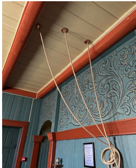
Tauføring, Vivestad kirke

Installert automatisk lukeåpner og klokkeringing med tau fra kirkens våpenhus. Vivestad kirke er listeført og prosjektet er godkjent hos Tunsberg biskop og riksantikvar. Prosjektet er ferdigstilt.