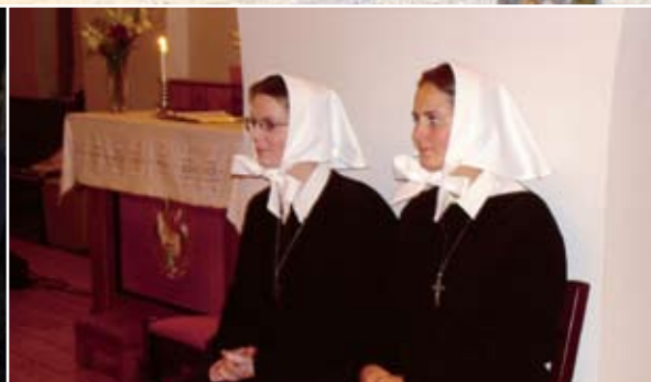
Lademoen menighet 100 år, side 5