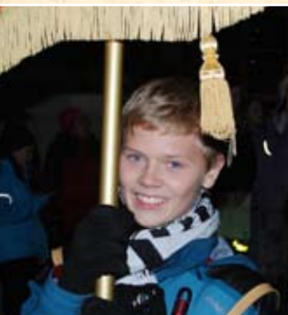
Lilleby skole, side 11