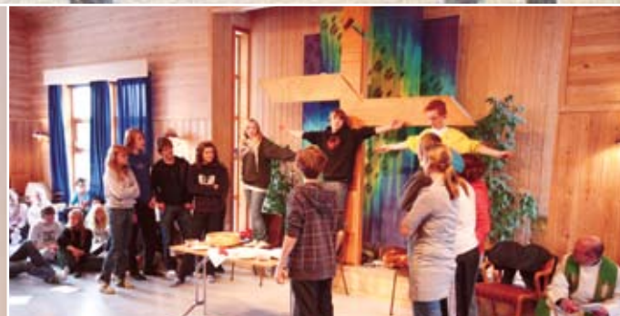
Konfirmantene, side 16