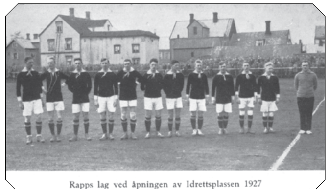
Rapps lag ved åpningen av Idrettsplassen 1927