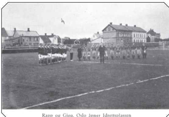
Rapp og Gjøa, Oslo åpner Idrettsplassen

Økonomien ble et problem og eldre medlemmer av klubben måtte tre til med private midler flere ganger. Derfor så klubben seg ikke i stand til å forlenge kontrakten da den gikk ut i 1935. Derfor fikk idrettsbanen på Voldsminde en ti års historie. At den fikk stor og positiv betydning for de unge som var aktive, er det ingen tvil om. Så kom byggingen av det store Voldsmindekomplekset fra 1935.