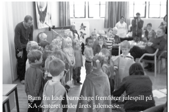
Barn fra Lade barnehage fremfører julespill på KA-senteret under årets julemesse.

Kontakt prestekontoret for utleie 46811936