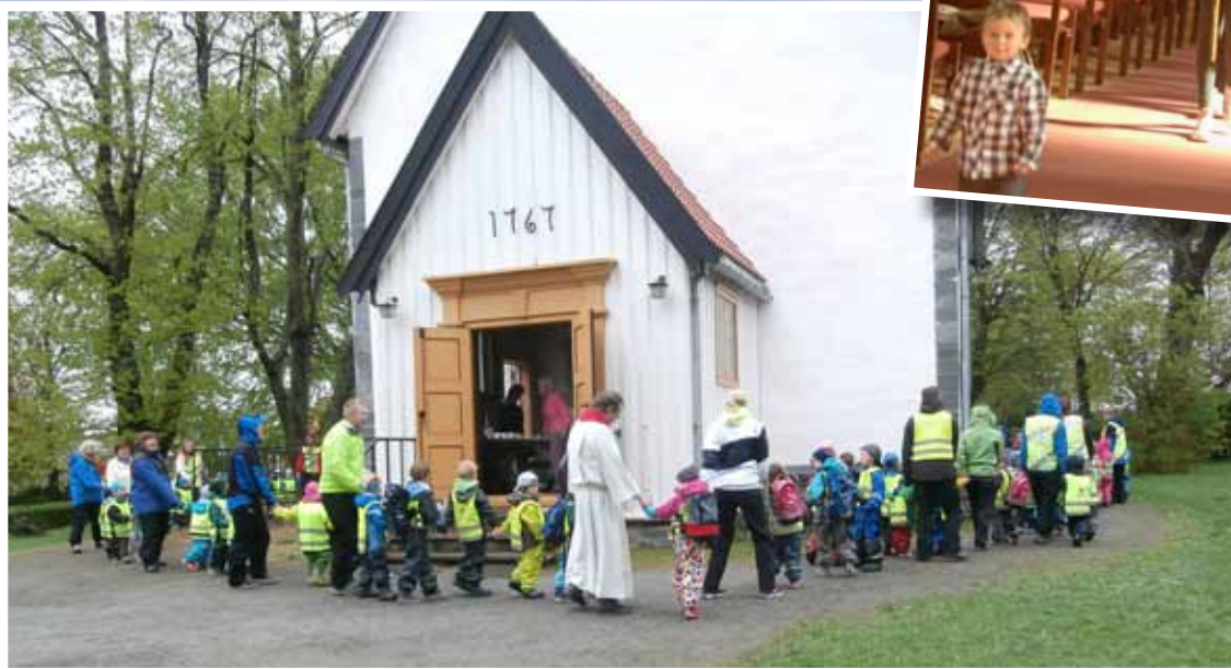
Barnehagebarn markerer kirkens fødselsdag med saft, kake og bursdagssang rundt Lade kirke.