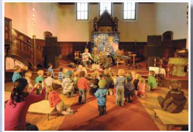
Barnekultur i Lademoen kirke.