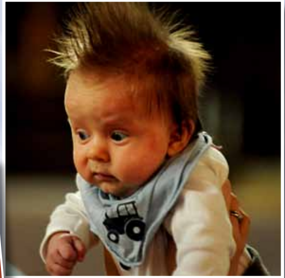
Babysang i Lademoen kirke