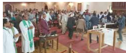
Postludiet etter gudstjenesten ble både sunget, spilt og danset.

I fem år har den etiopiske oromomenigheten holdt sine gudstjenester i Lademoen kirke. I august i år var de vertskap for en samling der representanter for tilsvarende menigheter over hele Europa deltok. Fra torsdag 7. til søndag 10. pågikk denne konferansen i kirken, og omkring 150 representanter deltok. Søndag 10. august hadde oromomenigheten ansvar for vår felles gudstjeneste i Lademoen kirke. Det ble en livfull og engasjerende gudstjeneste med mye sang, musikk og rytmer, med skriftlesning og preken på oromo, og med en fin nattverdfeiring. For de norske deltakerne ble dette som om en i noen timer var på besøk i Afrika. Stemningen fortsatte helt inn i lunsjen etter gudstjenesten, der det ble servert velsmakende etiopisk mat. Oromo er et av hovedspråkene i Etiopia.