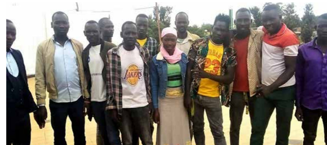
12 Hozo-talere fra landet invitert til en treningsøkt i Asosa.

Misjonsavtalen mellom Strinda menighet og NMS ble startet for mange år siden. Avtalen ble sist fornyet 1.1.2021 og varer til 1.1.2026. Vi ønsker at avtalen skal fungere som en påminnelse om menighetens ansvar for misjon. I avtalen tar menigheten ansvar for: