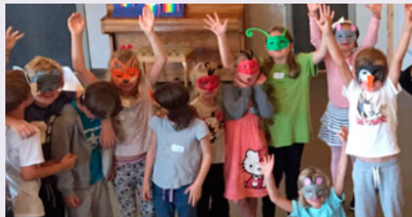
Med dyremaskene på tramper, sniker og danser barna inn til Noahs ark.

for alle som begynner i 2. trinn! Vi møtes i Byåsen kirke 13. august , og der skal vi snekre, lage dyremasker, spise, synge og spille. Vi hører historien om Noah og arken og regnbuen, og på slutten av dagen får familie og venner komme og se noe av det vi har gjort denne dagen. Dette er et samarbeid mellom Sverresborg, Ilen og Byåsen menigheter, og mange barn har vært med og hatt det gøy på dette tidligere. Invitasjon kommer i posten når det nærmer seg.