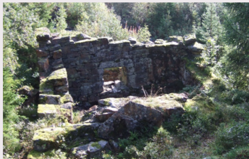
Øvre mølleruin 2009.

Ca 1870 sto det en stuebygning ved møllene. Den inneholdt kjøkken med skorstein og en stue uten kakkelovn, takst 50 spesidaler. Det var også registrert en stallbygning med 4 rom for hester, takst 20 spesidaler.