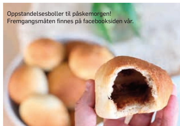
Oppstandelsesboller til påskemorgen! Fremgangsmåten finnes på facebooksidene våre.