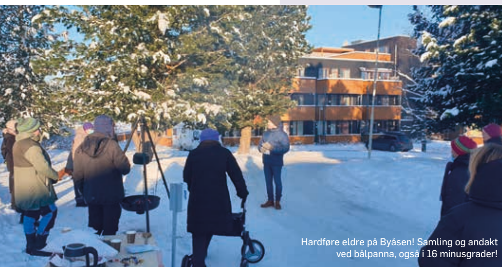
Hardføre eldre på Byåsen! Samling og andakt ved bålpanna, også i 16 minusgrader!