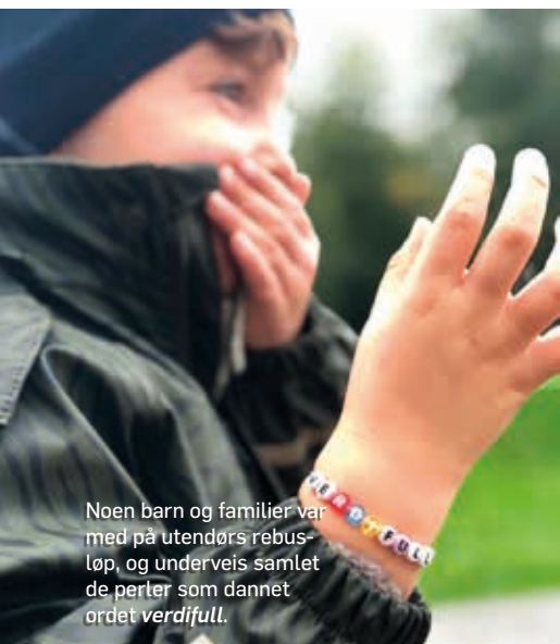
Noen barn og familier var med på utendørs rebusløp, og underveis samlet de perler som dannet ordet verdiful .

som mister noen de er glad i og som ikke kan ha alle de ønsker til stede i gravferden er også veldig vondt.