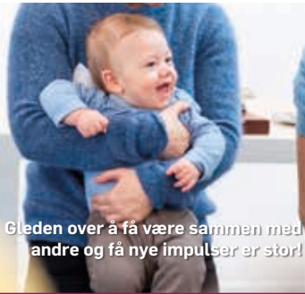
Gleden over å få være sammen med andre og få nye impulser er stor!