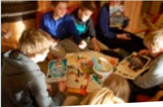
Vi prøver å uttrykke det gjennom å lage en skapelseskollasje.