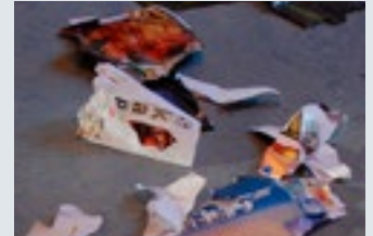
Men noen ganger går alt i stykker.

Glimt fra en dag på konfirmantleiren på Mjuklia for Sverresborg og Ilen