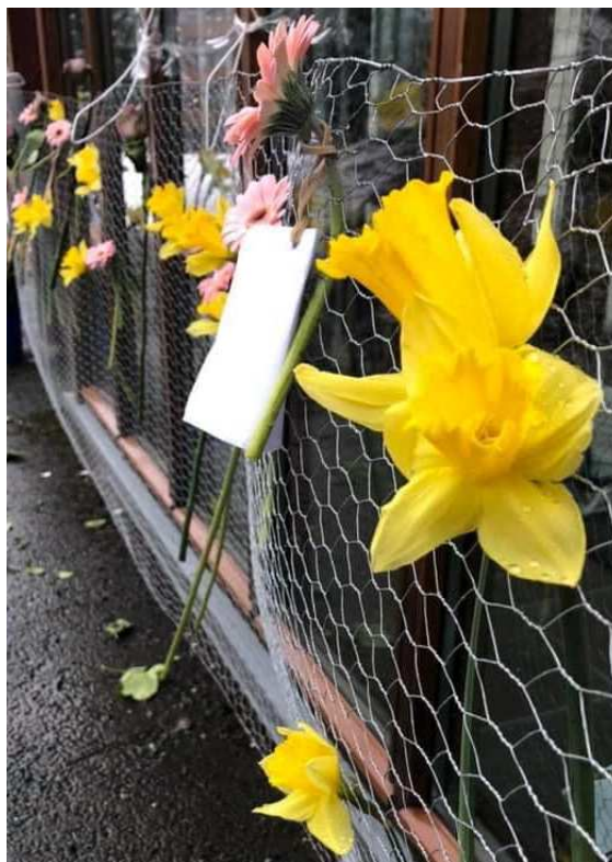
Foto: Håpsveggen i påsken

Når det gjelder kirkelige handlinger, har mange dåp og vielser blitt utsatt. Utfordringen har vært å legge til rette for alternative gjennomføringer med færre til stede, og flere små dåpsgudstjenester er avholdt. Alle gravferder er gjennomført, men med store begrensninger i forhold til antall som har kunnet delta.