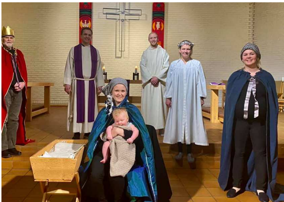
Foto: En godt fornøyd krybbevandringens gjeng.

Alle barnehagene innenfor Byåsen menighets grenser ble invitert til å delta enten på gudstjeneste eller krybbevandring til jul. Det er stor oppslutning om disse tiltakene til vanlig, i år var det 200 barn og voksne med på krybbevandringen.