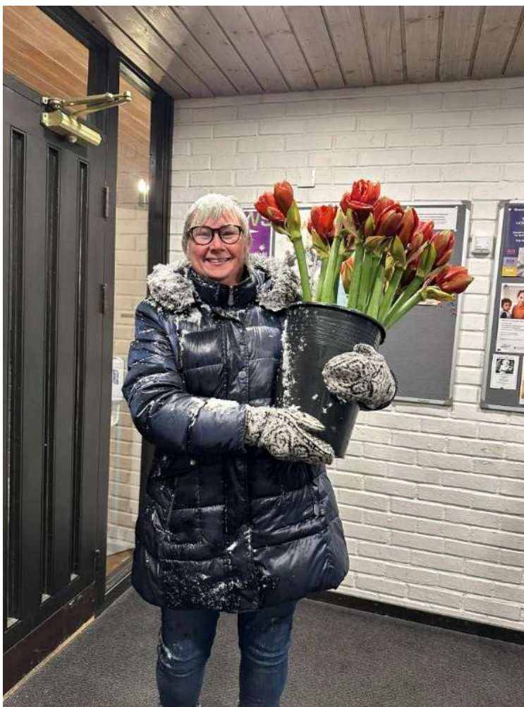
Diakonen går gjennom stormen for at vi skal få pyntet til julemiddagen.

Diakoniutvalget, diakon og prestene som står for utdelingen. I 2022 delte vi ut 35 blomster. De fleste pårørende setter svært stor pris at vi kommer på besøk. Sammen med blomstene får de invitasjon til minnegudstjenesten. De resterende som har mistet noen i løpet av året som har gått, får invitasjon til minnegudstjenesten i posten.