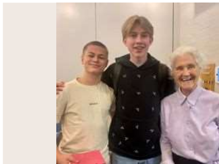
Et møtested mellom generasjoner