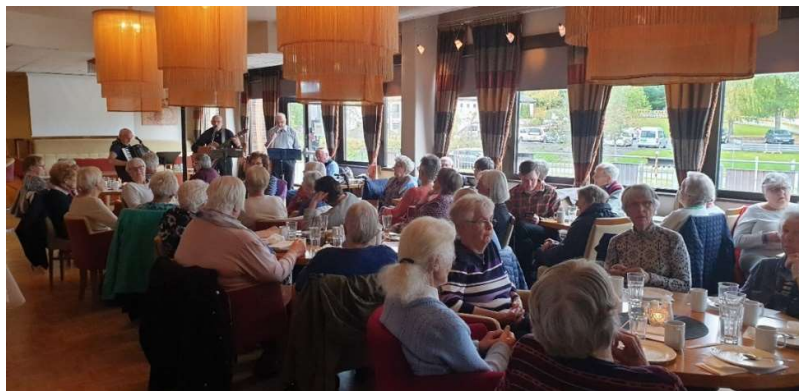
Menighetens hyggestund på Da Vinci med Melhus Pensjonistorkester.

Vi takker kjøkkengrupper, musikere, gjester og andre som har bidratt til menighetens hyggestund i året som gikk.