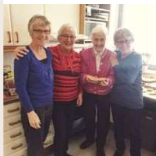
Jorunns vafler smaker helt vidunderlig