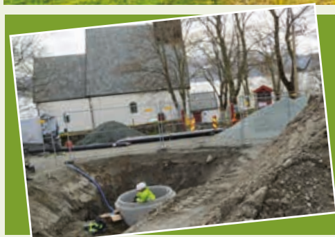
Graving i forbindelse med installasjon av sprinkleranlegget