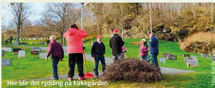
Her blir det rydding på kirkegården.