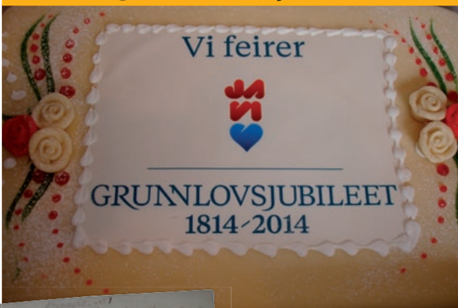
Byneset historielag spanderte jubileumskake.