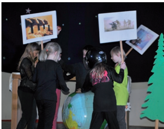
Jorda vår får gjennomgå ved forsøpling og forurensning.