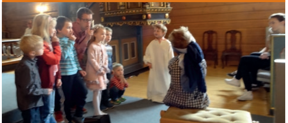
Dramatisering av den blinde Bartimeus.