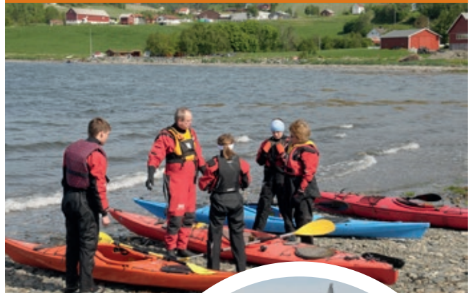
Kajak og seilbåt klargjøres.