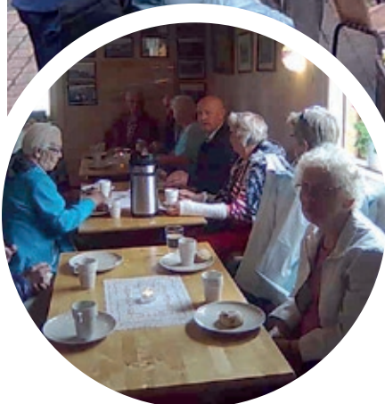
Kafferast på Vognildbua.