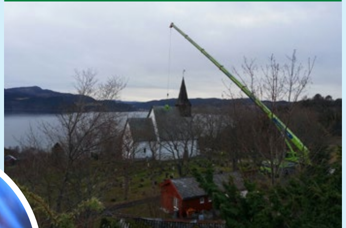
Ny takstein legges på plass på Byneset kirke