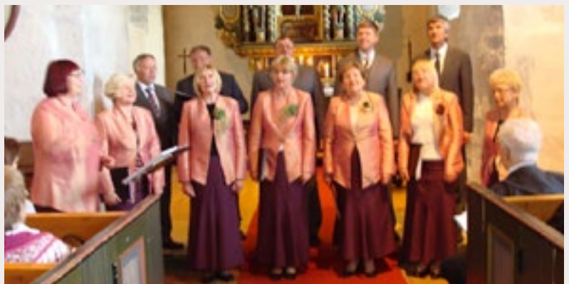
Besøk av koret «Sillervo» fra Helme i Estland. 14. juni 2015 i Byneset kirke.