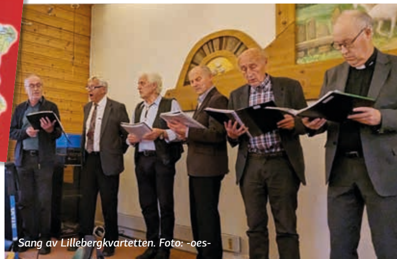
Sang av Lillebergkvartetten.