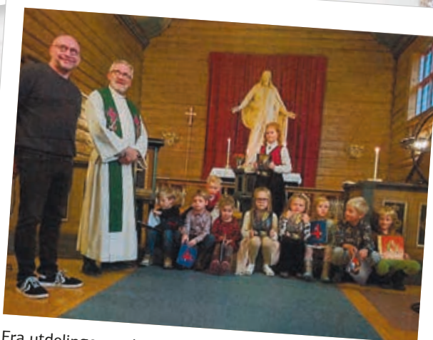
Fra utdelingen av bøker i Leinstrand kirke 15. oktober.