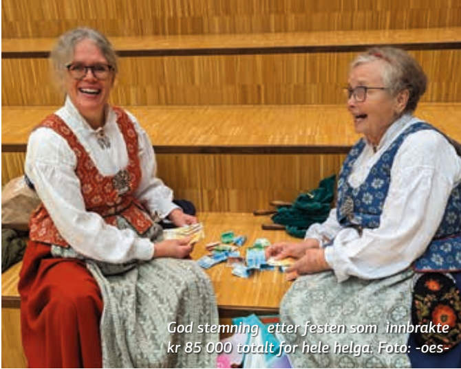
God stemning etter festen som innbrakte kr 85 000 totalt for hele helga.