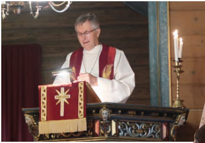
Biskop emeritus Tor Singsås holdt en fengslende preken om hvem Gud er.