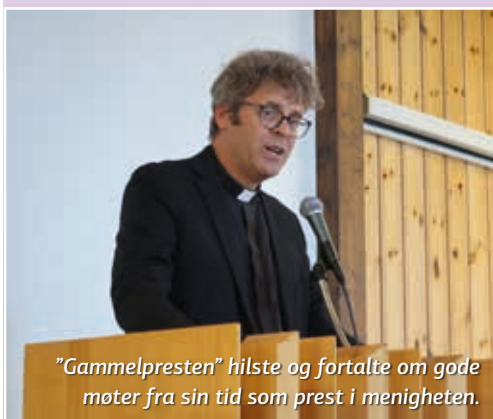
"Gammelpresten" hilste og fortalte om gode møter fra sin tid som prest i menigheten.

Bilder fra konserten kommer i neste nummer!