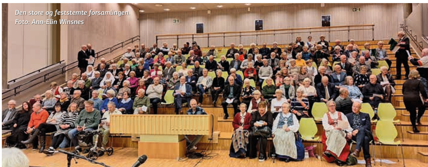
Den store og feststemte forsamlingen.