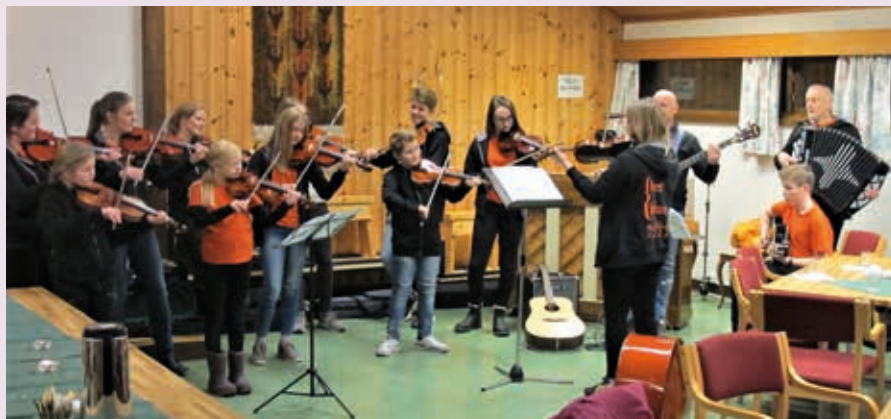
MUSIKK AV BYNESET SPELLMANNSLAG på «Middag og musikk» i Esp bedehus.