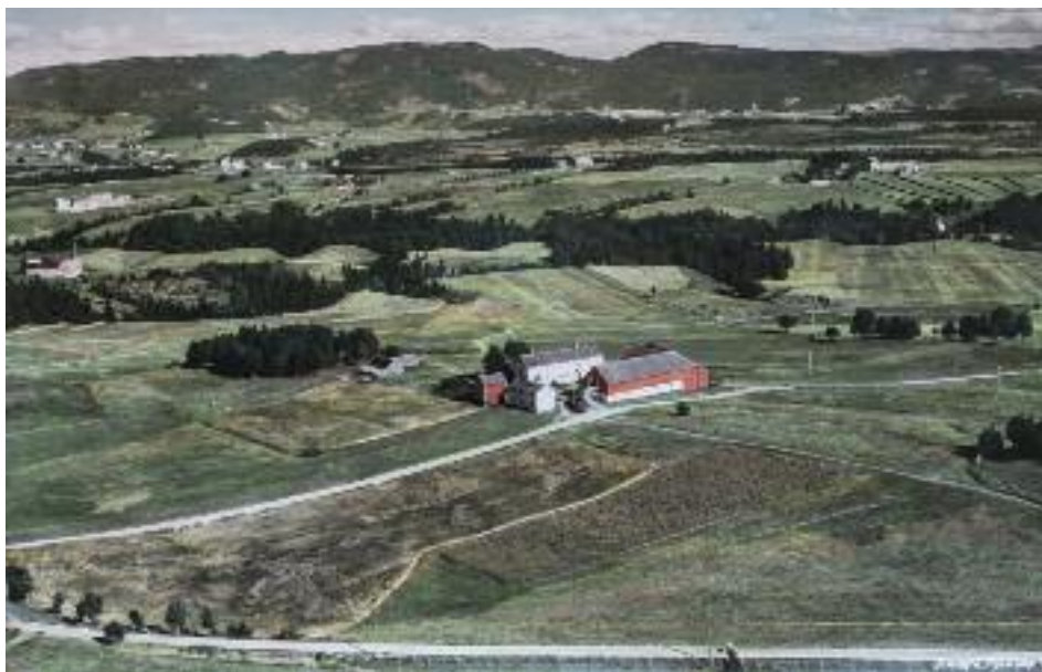
Søbstad nordre med Kongsvegen nærmest i bildet på flyfoto fra ca 1955.

det både idrettslag og gudstjenester i tilfluktsrommet. Så ble Kolstad menighet skilt ut fra Heimdal, og den nye fine kirka fra 1986 ble bygd, ikke på Kolstad, men på Søbstad/Saupstad , nesten på tunet til gamle Søbstad gård oppe ved Kongsvegen. Burde ikke kirka strengt tatt hete Søbstad kirke?