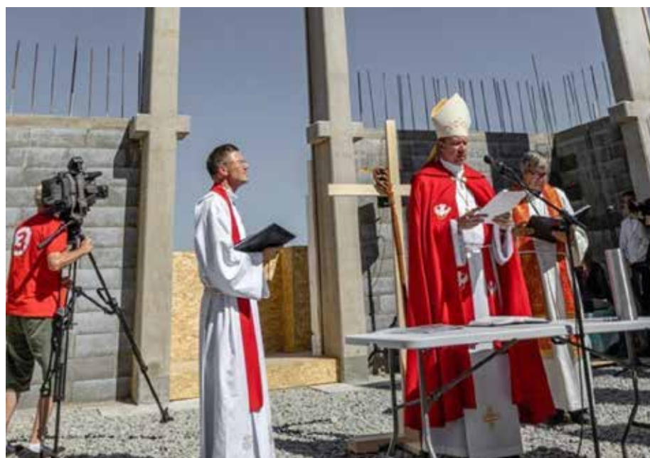
Saku kirke, Estland

Det Norske Misjonsselskap, NMS, har samarbeidet med den evangeliske lutherske kirken i Estland siden 2003. Heimdal menighet inngikk en samarbeidsavtale med NMS i 2011 om Menighetsutvikling i Estland. Hovedinnholdet i avtalen er to-delt, forbønn