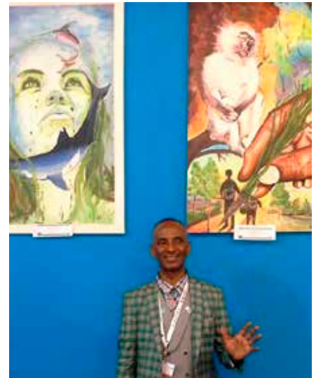
Habteweld på utstillingen i New Delhi