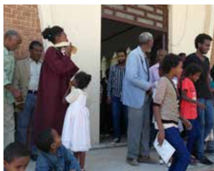
Vennskapsmenigheten i Keren i Eritrea

Vennskapsmenighetene ber for hverandre i gudstjenesten, og iblant er det kollekt enten til menigheten i Keren eller til døveskolen, som drives av den evangeliske kirken. Det handler om både åndelig og økonomisk støtte, men like mye om fellesskap og gjensidig kontakt, til tross for politiske og andre hindringer som etter hvert har dukket opp.