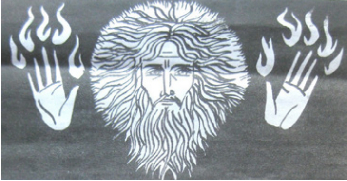
Litografiet «Father Joseph» av Daniel Nichols

Da reiste den gamle mannen seg opp, rakte hendene mot himmelen; fingrene ble som ti lamper av flammer, og han sa til ham, 'Hvis du ønsker, kan du bli til ren ild.'»