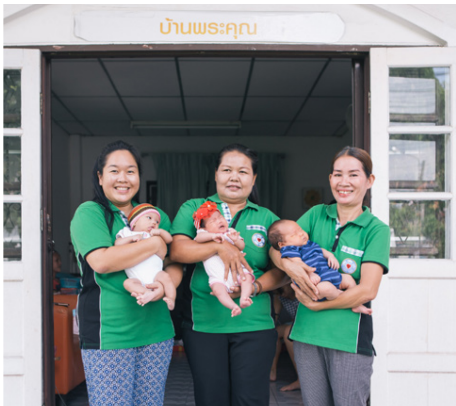
Ansatte viser stolt fram barn fra Nådehemmet.