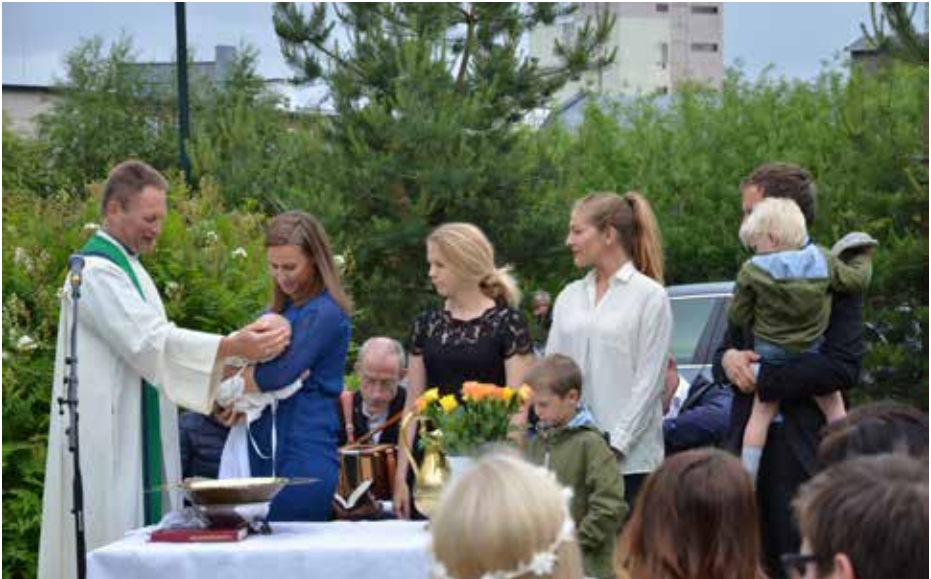
5. juni blir det ny friluftsgudstjeneste ved Ilabekken. Dette bildet er fra 2015.

Så sett av dagene 31. mai til og med 5. juni og bli med å feire 30-årsjubileum. Hjertelig velkommen til alle og enhver!