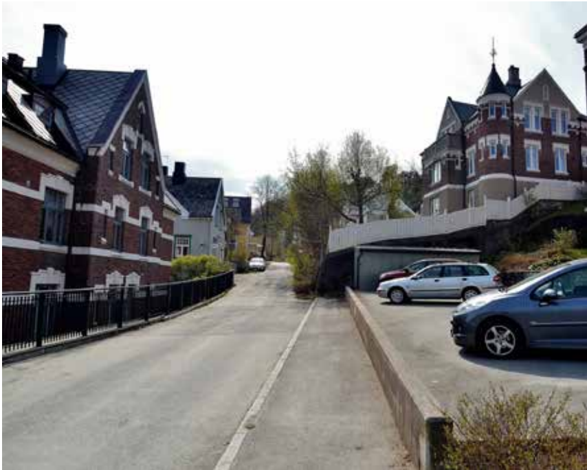
Bilde: Finn Nilsen

Kilde: «Steder og navn i Trondheim» og «Trondheim byleksikon»