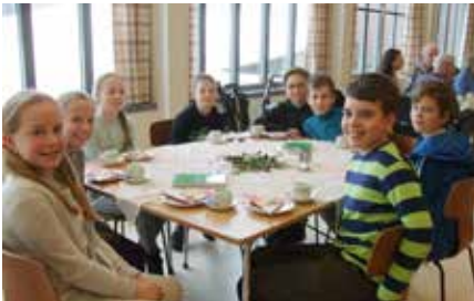
Bildet er fra fjorårets klasse.

Du er hjertelig velkommen i menighetssalen torsdagene 1. september, 6. oktober, 3. november og 1. desember. Hver gang kl. 11. Det gleder oss at årets sjetteklassinger fra Ila skole deltar, tradisjonen tro, med servering og loddsalg.