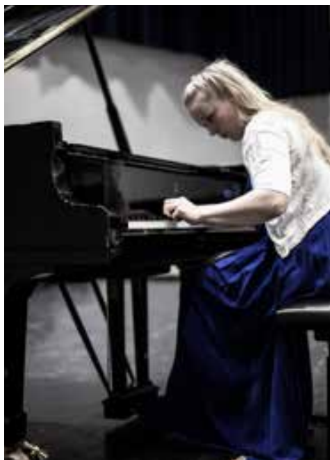
Bilde: Ola Tjøeder