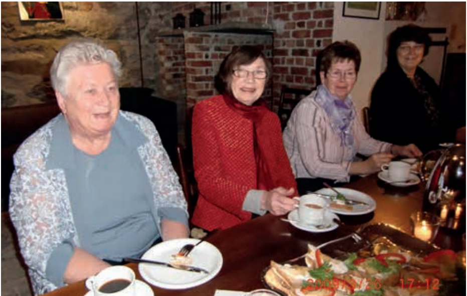
Ti år med hygge og nytte

Det ble også tidlig opprettet nær og god kontakt med Menighetsråd og Kirkeverge. Gjennom dette tette samarbeidet kom vi tidlig i gang også med «forskjønnelse» av Stavne kapell. En stor gave ga startkapital til nødvendig utvendig restaurering og det særs gode samarbeidet med Kirkevergen gjorde at også den innvendige restaure-