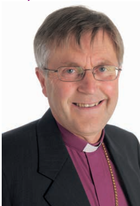
Biskop Tor Singsaas

«Solbarn - Stjernebarn - Jordbarn - Håpsbarn - Fredsbarn - Barn fra evighet»