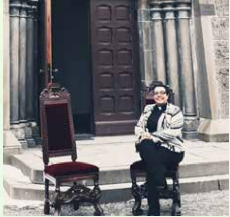
Sokneprest April ved klagestolen.

Nærmere informasjon om tid og sted kommer på www.iladagan.no og på Ilen menighets hjemmeside.