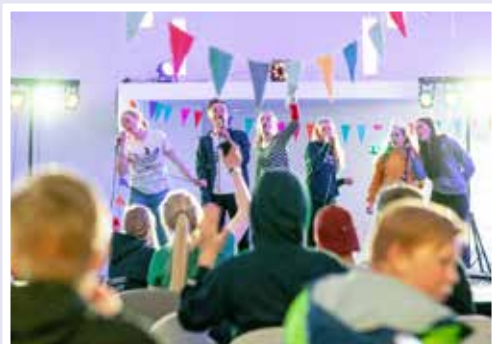
Ungdommer i aksjon på Sverresborg Kirkesenter.

30. april fra kl. 19.00 holder Sverresborg Kirkesenter åpent for ungdom fra 8. klasse. Det blir gratis-kafé, underholdning, gratis-lotteri, playstation, quiz, disco, karaoke, konkurranser og brettspill. Velkommen!