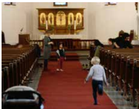
Ny rekord på 100-meteren.

Det er 15 minutt att til korøvinga startar. I benkane sit nokre tidleg møtte foreldre i roleg småprat, men det er i midtgangen det går føre seg. Små barneføter trommar i full fart over kyrkjegolvet – det er latter og roping. Berre det å vere inne i det store, flotte rommet inviterer til leik.