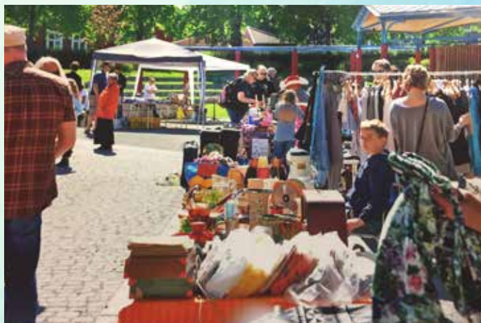
Marked i Ilaparken under Iladagan 2015.