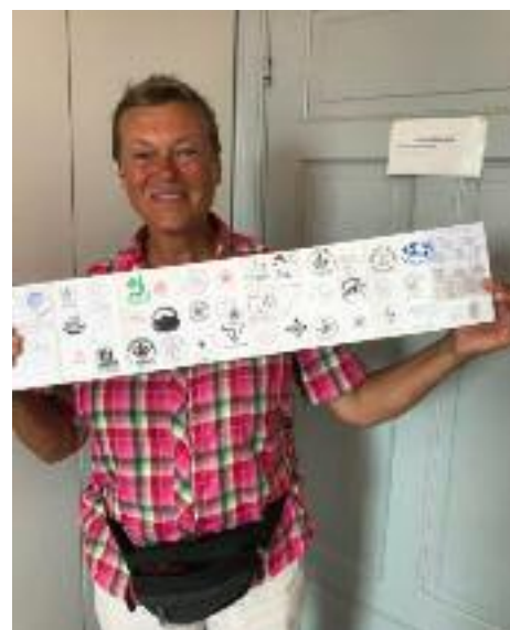
Pilegrimsbesøk i Tiller kirke. I sommer var Tiller kirke åpen noen onsdager. Flere pilegrimer stakk da innom kirka, blant annet denne tyske dama som her viser sitt pilegrimspass.

Over hele verden finnes det slike steder, som spesielle hendelser og menneskers tro, tid og tradisjon har ladet med mening: Mekka, Jerusalem, Santiago de Compostela, Nidaros - eller et kapell i et digert hult tre i Keren i Eritrea eller en vannkilde i skogen et sted i Norge. Og over hele verden, i århundrer, har mennesker brutt opp fra sitt vanlige liv og gift seg ut på lange reiser for å nå slike hellige steder. Mange pilegrimer har som Kristin Lavransdatter, båret på en byrde de vil legge fra seg, mange har søkt