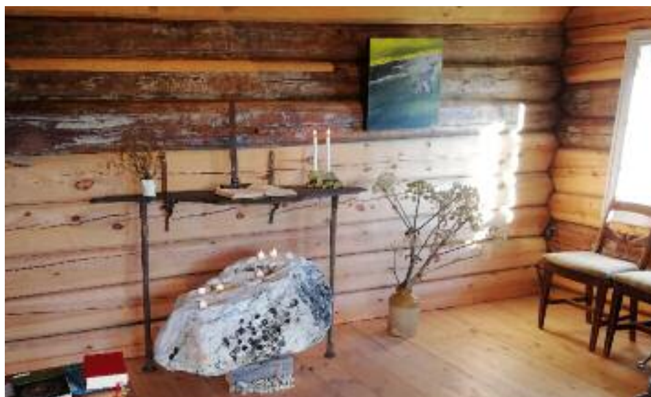
Kapellet på Fokkstugu.