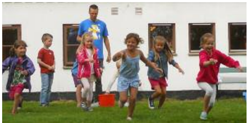
Vann-konkurranse fra Under- og undredag 2012