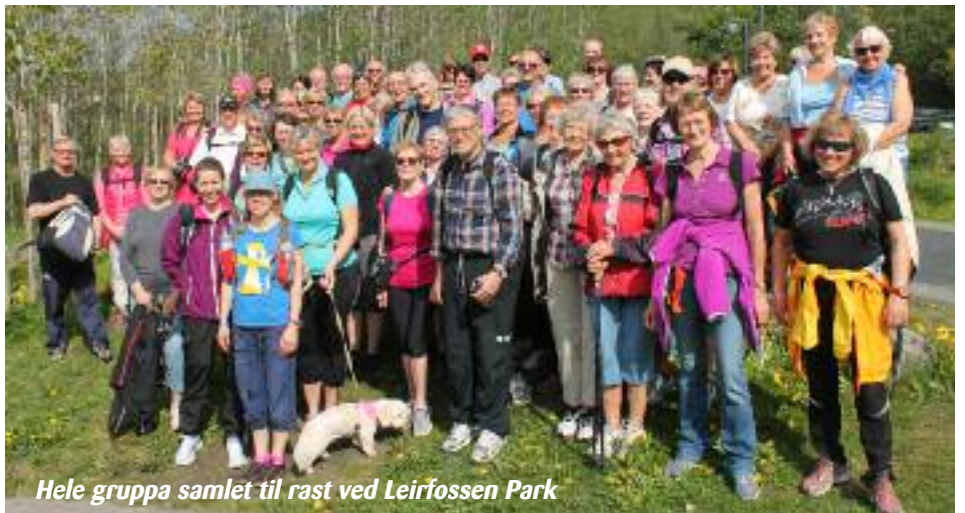
Hele gruppa samlet til rast ved Leirfossen Park

levelser under veis. Ekstra flott var det å ta en hvil ved Leirfoss Park. Et vakkert og fredfullt sted. Her fikk vandrene forfriskninger servert som påfyll til videre vandring.