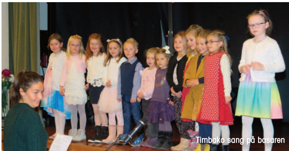
Timbako sang på basaren