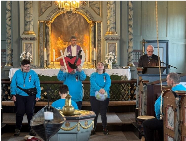
Kor Artig sine medlemmer leder festgudstjenesten i Klæbu i forbønn

Det var to kirker i byen som for første gang fikk besøk av Kor Artig. I den forbindelse er det planleggings- og refleksjonsarbeid med kirkelige ansatte da det ofte også trengs tilrettelegging.