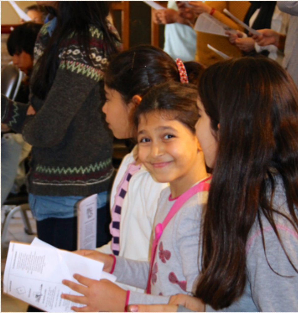
Bildet: Noen av barna som går i Antalya Evangelical Church