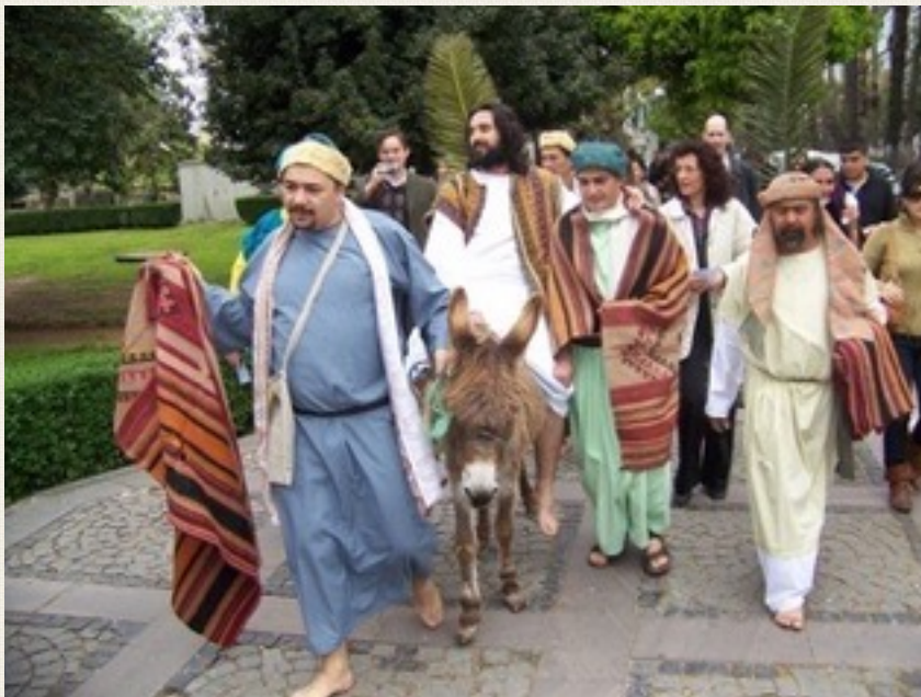
Menigheten i Antalya ønsker å dele troen sin med andre. Her feirer de palmesøndag med et opptrinn i gatene i Antalya.

Til refleksjon: Tenk på bakgrunn eller nærmiljø som din kirkes medlemmer er en del av. Vet du noe om hva som kan være spesielle utfordringer i forhold til dette? Gjør din menighet noe for å finne ut av hva som kan være vanlige utfordringer for mennesker i din menighet?