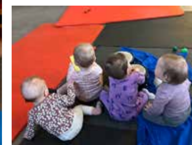
Stemningsrapport fra noen av aktivitetene i kirkene.