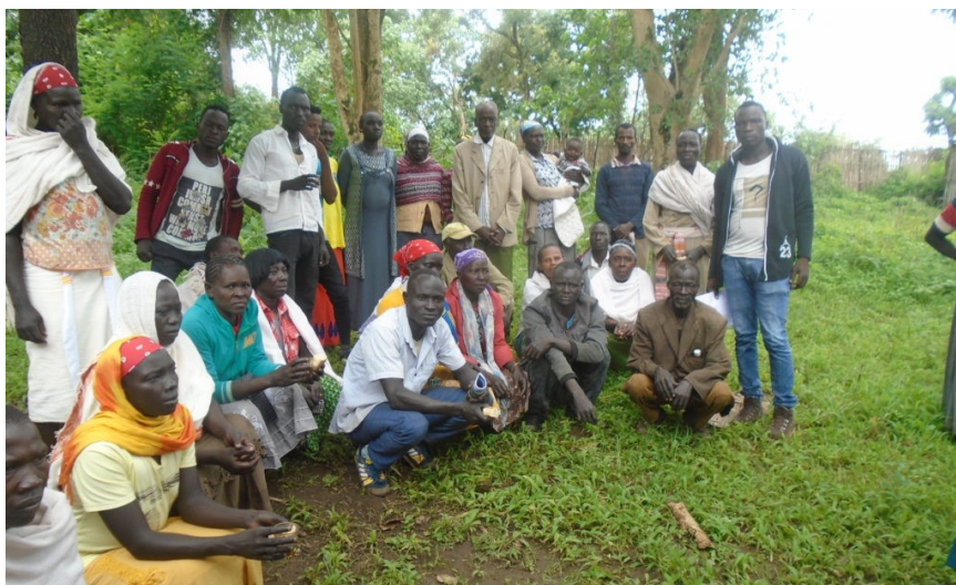
Kurs for menn og kvinner i miljøbevissthet