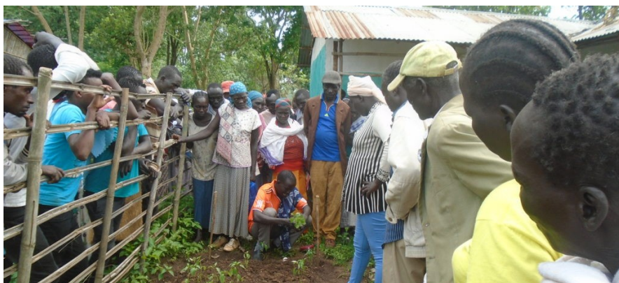
Bønder får opplæring i hvordan man planter, høster og tilbereder grønnsaker

Her nede finner du bilder fra kurs for bønder i bl.a. birøkt, planting av trær, massemobilisering om miljø og mange andre spennende aktiviteter!