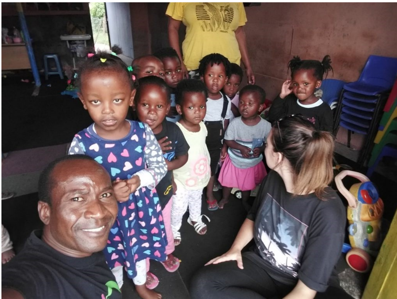
Tich sammen med barna i barnehagen i East London i Sør-Afrika

“Jeg lever ikke lenger selv, men Kristus lever i meg.” Galatene 2:20