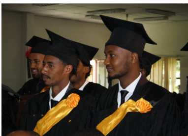
I svart og gult: Unge menn som har fått Bachelor graden i musikk og media

situasjonen kan sammenlignes med det norsk-samiske forholdet i deler av Nord-Norge for kanskje hundre år siden.