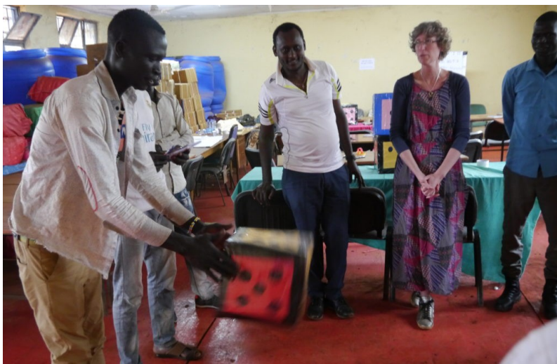
Spill med terning laget av en pappeske

Siste dagen begynte vi også å bruke kortene til å lage historier. Først lagde vi en kort historie med bildekortene, og deretter fant vi riktig ord til bildene slik at vi allerede hadde alle viktige stikkordene for å skrive historien. Vi skal ikke se bort ifra at det kommer noen artige historier fra disse skolene i fremtiden!