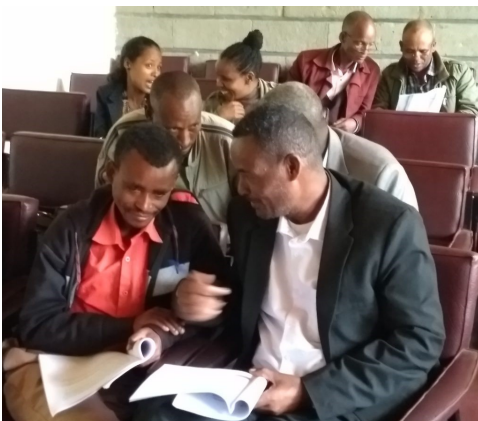
Livlig diskusjon blant deltakerne ved Cross Cultural Training i Hosanna

Vi sitter i bilen på vei hjem etter et tre dagers kurs i Cross Cultural Training (CCT) i Hosanna. Med oss har vi fem deltakere som vil sitte på et stykke, og praten går høyt om hva de har lært. Deres hverdag består i å være misjonærer i et land hvor det er over 83 ulike folkegrupper, og flere av de som er med i bilen krysser språklige og kulturelle grenser i sitt daglige arbeid, men har ikke selv bevisst lært seg et annet språk. I stedet har de brukt sitt eget språk, og folket de er misjonærer blant har endt opp med å lære deres språk i stedet!