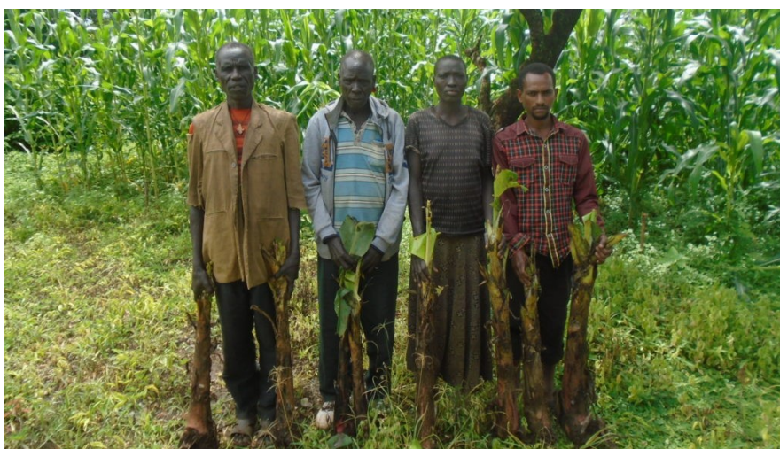
Stolte bønder med banantrær