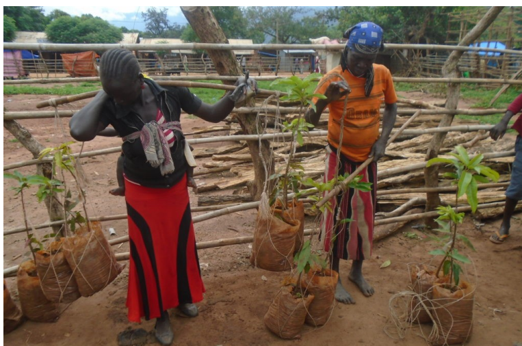
Trær til utplanting fraktes på den tradisjonelle måten. Lokalbefolkningen er aktivt med på alle aktiviteter og bidrar med transport