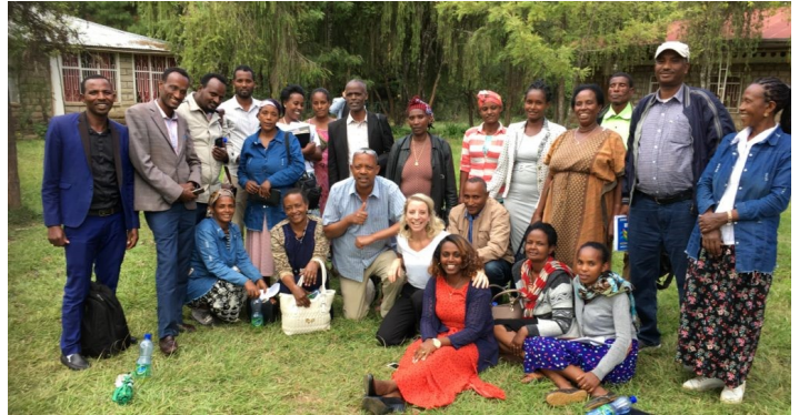
Alle deltakerne på Tamar Campaign fra tre av Mekane Yesus' synoder samlet for to dagers bibelstudie