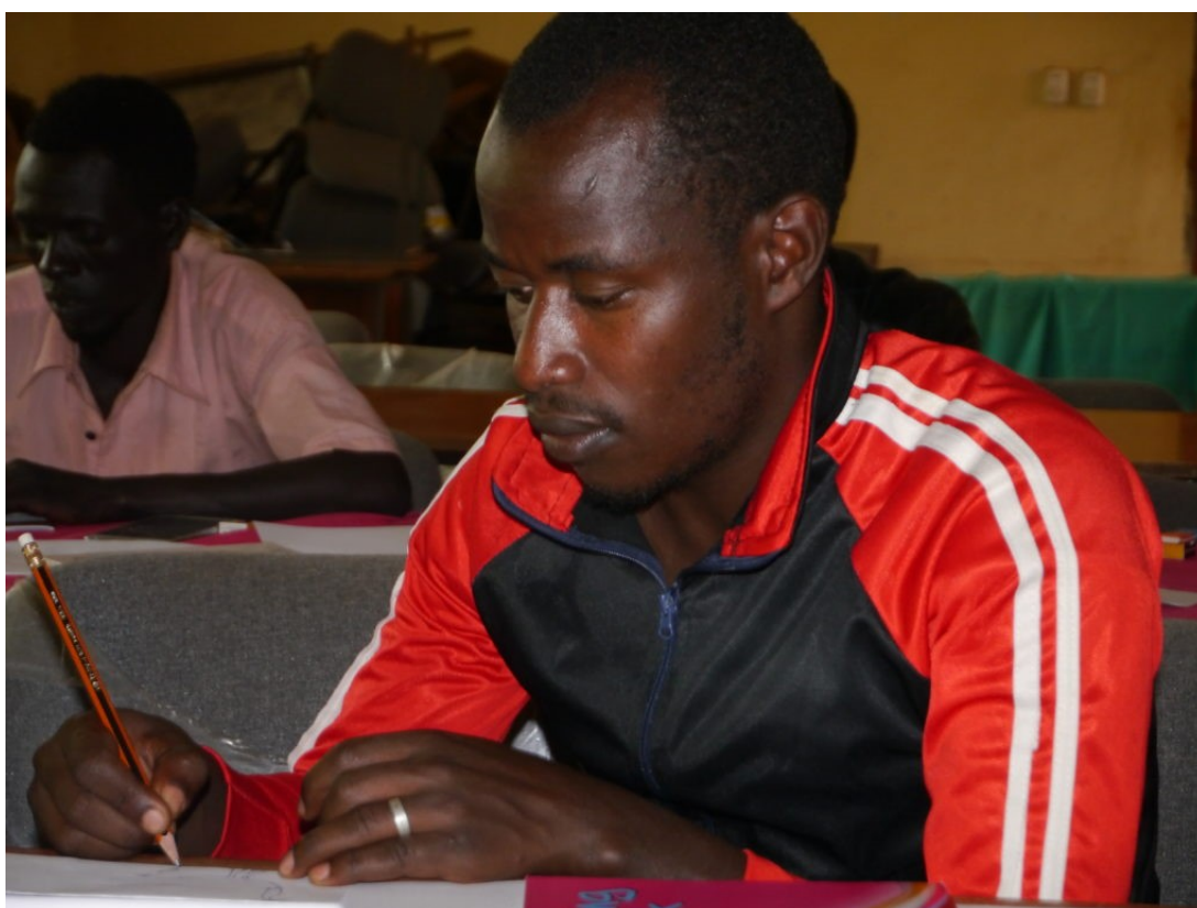
Mawiya har allerede illustrert en del før, og var en av de mer erfarne tegnerne i workshopen

- I vårt samfunn blir vi ikke oppfordret til å drive med kunst og tegne illustrasjoner. Men vi har en vakker kultur og et fint land-