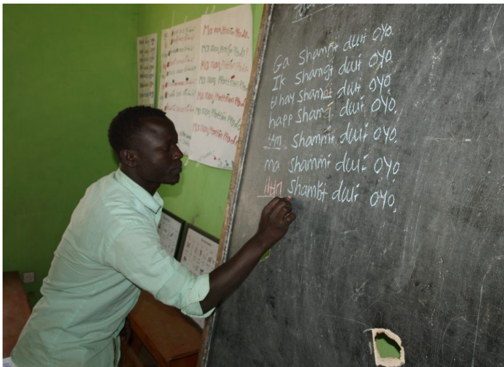
Setning for setning - skrivetrening på Gwama ved Mao Komo Cultural Centre

En gledelig nyhet til slutt: En av de unge Komo som hadde fått trening gjennom prosjektet ble rekruttert som «språkekspert» ved distriktskontoret for utdanning i Benishangul-Gumuz, og en annen Komo ble ansatt som morsmållærer i Tongo!