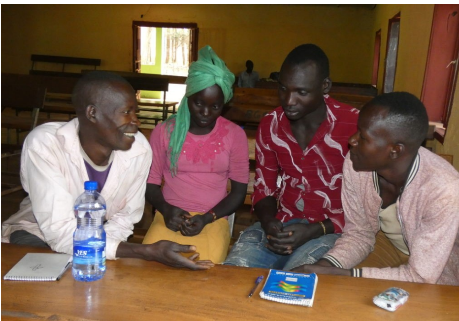
Oral Bible Story workshop for mao hozo

Det er mye godt en kan si om det som skjer i Etiopia for tiden. Men spøkelsene fra fortiden har ikke forsvunnet – langt ifra. I mange deler av landet er det brutale sammenstøt mellom etniske grupper, og vold og diskriminering av minoriteter har ikke blitt borte.