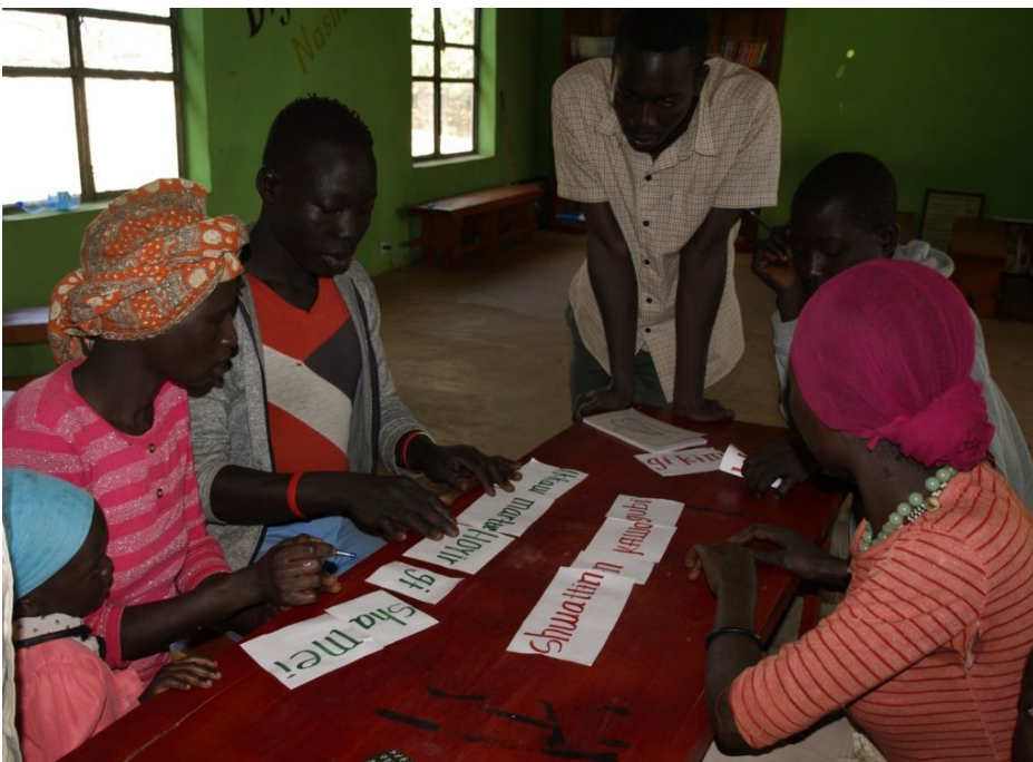
Ord blir til setninger. Morsmåls-alfabetisering på Gwama

Mao Komo arbeidet foregår i det stille. I hele 2018 har det vært uroligheter og etniske spenninger i området, og det fortelles om overgrep og fordrivelse, spesielt i Oromia, hvor arbeidet med minoriteter er forbudt. Så her gjelder det å gå varsomt frem. Flertallet i området er muslimer, og de kristne kirkene har ikke noe godt rykte; evangeliseringen oppfattes som aggressiv og lite sensitiv.