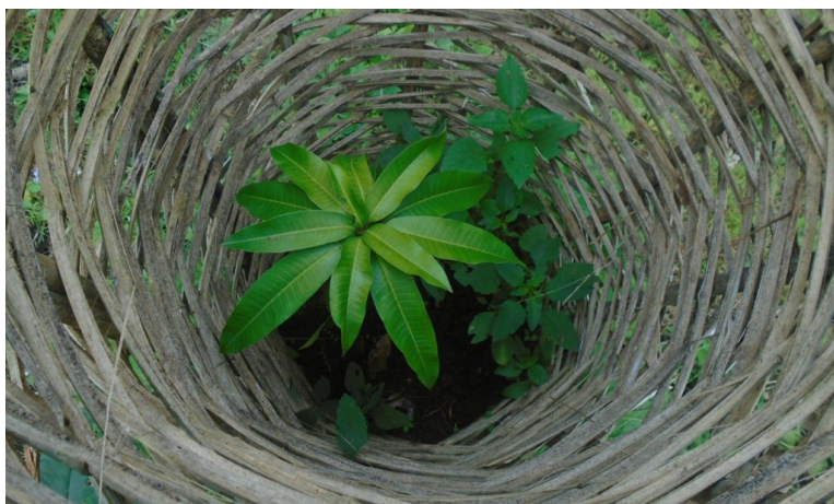
Mange hundre mangotrær har blitt plantet