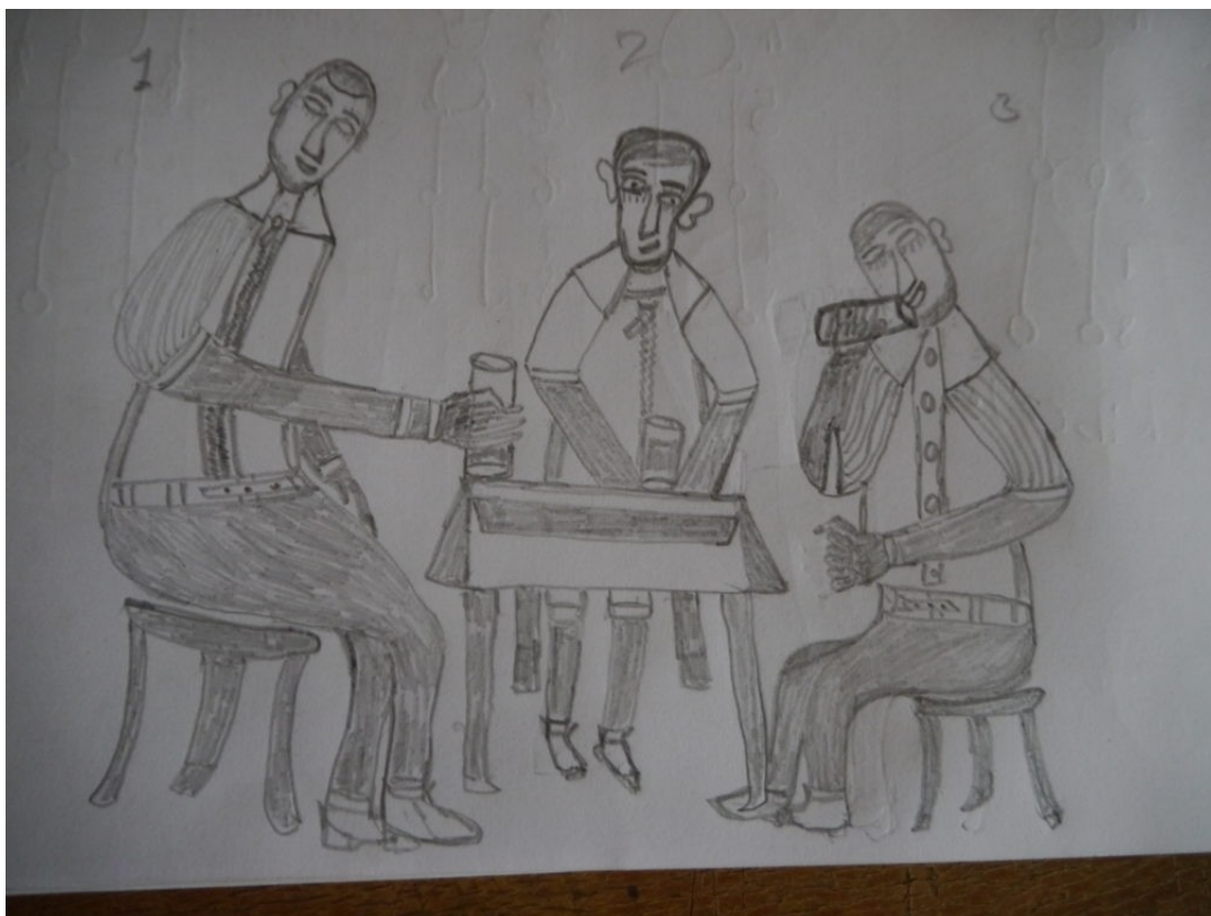
Et av Mawiyas første bilder som illustrasjon til en historie. Her er det mye bra, og litt å rette opp i.

skap som vi kan male! Jeg liker veldig godt å tegne, men jeg fikk ikke mulighet til å gjøre det som barn. Nå er jeg så glad og føler meg privilegert over å være en del av dette verkstedet. Fra nå skal jeg tegne og tegne og tegne. Jeg vil produsere flere historier og lage gode illustrasjoner for samfunnet vårt. Takk for prosjektet!