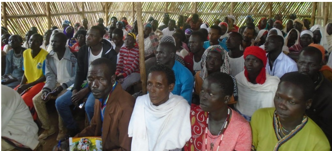
Massemobilisering om sparing og oppretting av egen business for menn og kvinner. Kvinnene skal organiseres i låne- og spare-grupper

Yaso posjektområde er det nyeste området i landsbyutviklingsprosjektet Green LiP. Selv om området har vært preget av veldig mye uroligheter har de likevel begynt med mange spennende aktiviteter.