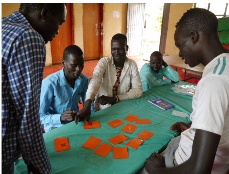
Deltakerne sorterer alfabetkort

Mao Komo prosjektet har allerede utstyrt fire landsbyer med et landsbybibliotek og en bibliotekar som tar vare på bøkene som har blitt produsert i prosjektet. Hver måned skriver de rapporter om hva de gjør med barna som kommer for å lese, og hvilke aktiviteter de gjør med dem. Materiellet som vi produserte i denne workshopen skal blant annet brukes i landsbybibliotekene.