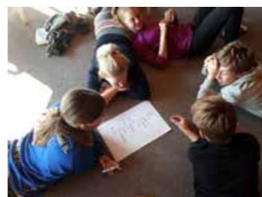
Gruppearbeid om gudstjenesten