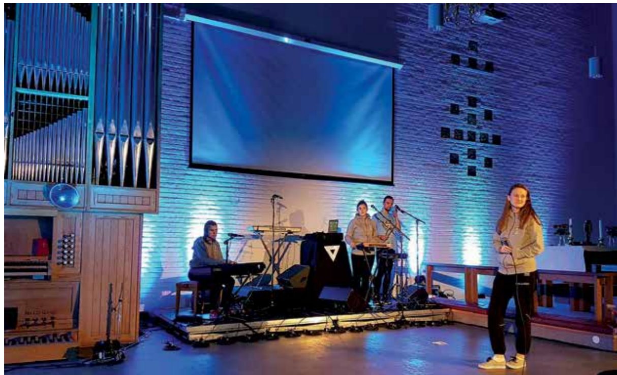
Ten Sing Norway holder konsert i Strindheim kirke

Tema for lederdagen var identitet, hvordan være seg sjøl og hvordan stå opp for andre. Alt i en kristen sammenheng. Dagen veksla mellom foredrag, samtaler og leiker som alle belyste temaet.