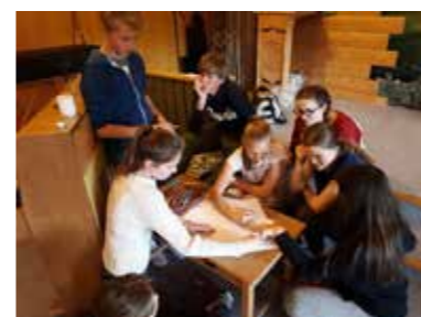
Jesu liv og virke