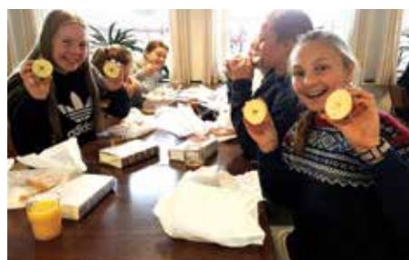
Stjernen i eplet