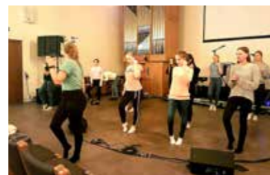
- Konfirmentene i Strindheim menighet øver inn en dans sammen med Ten Sing Norway