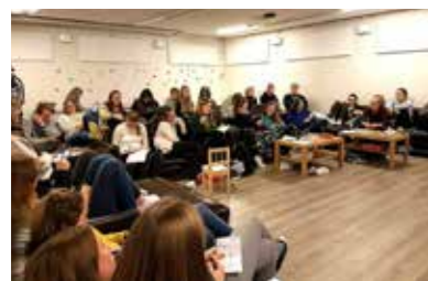
- Undervisning på lederdagene

De ønsker med dette å sette fokus på globale problemer og lokalt arbeid. KFUK-KFUMs Ten Sing-arbeid jobber med bakgrunn i idéen om ungt ansvar og voksent nærvær. Vi ønsker også å ta opp samme idé, men med en liten vri: Menneskelig ansvar, guddommelig nærvær.