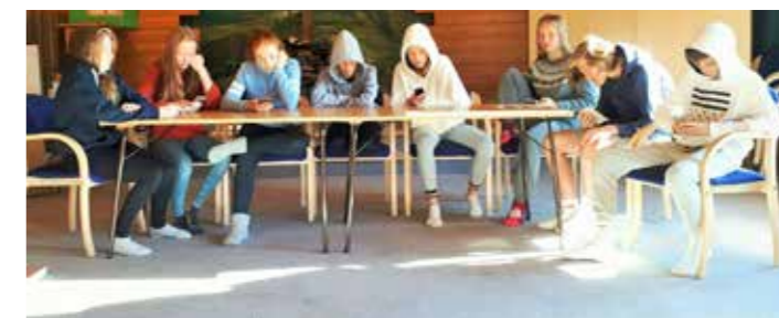
Det siste måltidet anno 2017