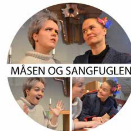
MÅSEN OG SANGFUGLEN