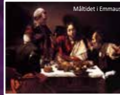
Måltidet i Emmaus