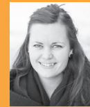
Tekst: Maria Foldnes Fiske

Endelig kommer bussen og stopper for han i rødt og han i blått. I hele 10 minutter har de stått med ryggen til alt det vakre som har skjedd. Ikke én eneste gang har de snudd seg. Det glimtet jeg fikk av himmelen denne morgenen gikk dem hus forbi. Jeg tror det handler om valg. På denne travle februar dagen valgte jeg å stoppe opp og beundre verket av Guds hender. Vi må stadig velge å la Gud slippe til i livene våre.