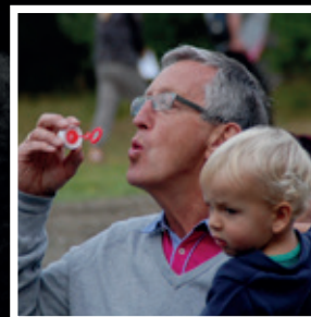
Kirketorsdag s 6